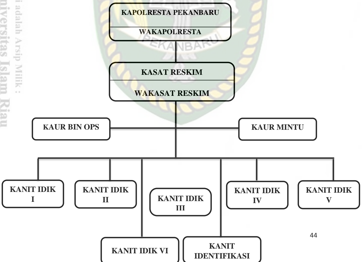
Table I. 2 Struktur Organisasi Polresta Kota Pekanbaru

Mengenai struktur organisasi Polresta Kota Pekanbaru berdasarkan kesatuannya, tugas dibidang masing-masing bagian, bisa dilihat pada table II.2 sebagai berikut :