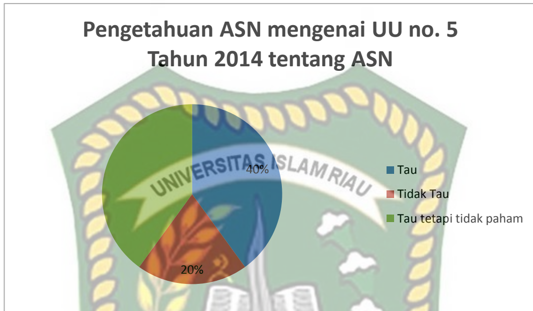
Tabel Diagram 3.3

Dengan demikian, dari presentase dan wawancara diatas dapat menunjukkan bahwa saat ini pengetahuan ASN tentang peraturan meliputi kedisiplinan, kode etik, dan hal-hal terkait kinerja ASN tidak sepenuhnya benar benar dipahami oleh ASN itu sendiri. Dari Chart tersebut dapat dilihat bahwa Pengawasan yang dilakukan oleh Inspektorat berdasarkan UU sebenarnya sudah cukup maksimal namun kembali lagi ke Personal dari ASN tersebut. Kurangnya pengetahuan ASN mengenai tata tertib atau SOP dalam bekerja dan faktor kurangnya tenaga auditor membuat Inspektorat Pekanbaru kurang dalam melaksanakan kerjanya.