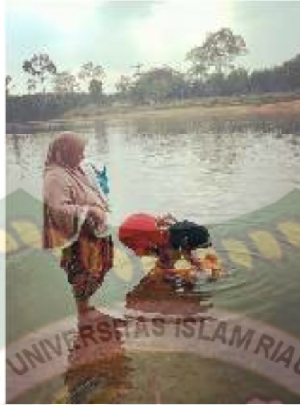
Gambar 1. Acara turun mandi yang diiringi dengan Batimang

Nilai pendidikan moral juga sangat berpengaruh dalam tumbuh kembang anak, nilai moral merupakan nilai yang berhubungan dengan kepribadian, tata krama yang berhubungan dengan sifat dan sikap, baik dengan keluarga, lingkungan maupun diri sendiri, sebab nilai moral seseorang merupakan ciri khas dari orang tersebut.