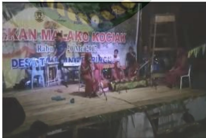
Gambar 2. Lomba Batimang yang di padukan dengan Calempong

Untuk lebih jelasnya dapat dilihat dokumentasi berikut ini yang merupakan salah satu gambaran dari pendidikan budaya yang diadakan diantara masyarakat. Juga dapat dilihat dalam gambar tersebut bahwa pada acara masyarakat, Batimang selalu ditampilkan dan dikolaborasikan dengan musik daerah yaitu Calempong sebagai pelestarian budaya dan edukasi bagi masyarakat, agar masyarakat tidak pernah melupakan kesenian Batimang daerah tersebut.