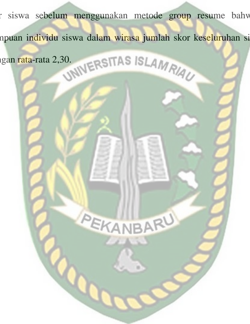
Tabel 11. Hasil Nilai Tes Siswa Memahami Gerak Tari Persembahan Dengan Menggunakan Metode Group Resume SMPN 1 Rengat Barat Kecamatan Rengat Barat Kabupaten Indragiri Hulu Pertemuan 1 2 3 4 Siklus II

Berdasarkan tabel diatas ditemukan pada penilaian tahap praktek awal hasil belajar siswa sebelum menggunakan metode group resume bahwa ternyata kemampuan individu siswa dalam wirasa jumlah skor keseluruhan siswa adalah 60 dengan rata-rata 2,30.