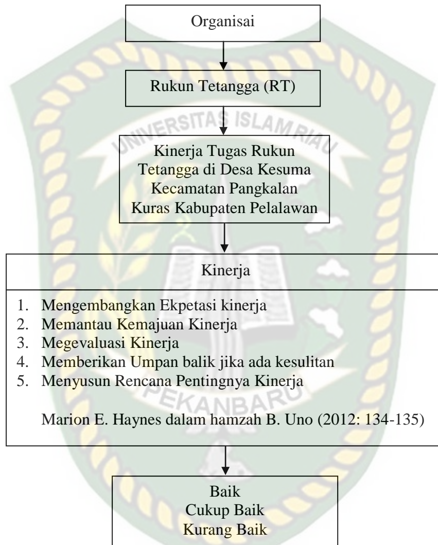
Gambar 2.1 Kerangka Pikir Tentang Kinerja Tugas Rukun Tetangga di Desa Kesuma Kecamatan Pangkalan Kuras Kabupaten Pelalawan