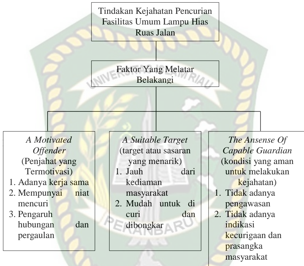
Gambar II.1. Model Kerangka Pemikiran Analisis Kriminologi Terhadap Pencurian Fasilitas Umum Berupa Lampu Hias Ruas Jalan Di Kota Pekanbaru