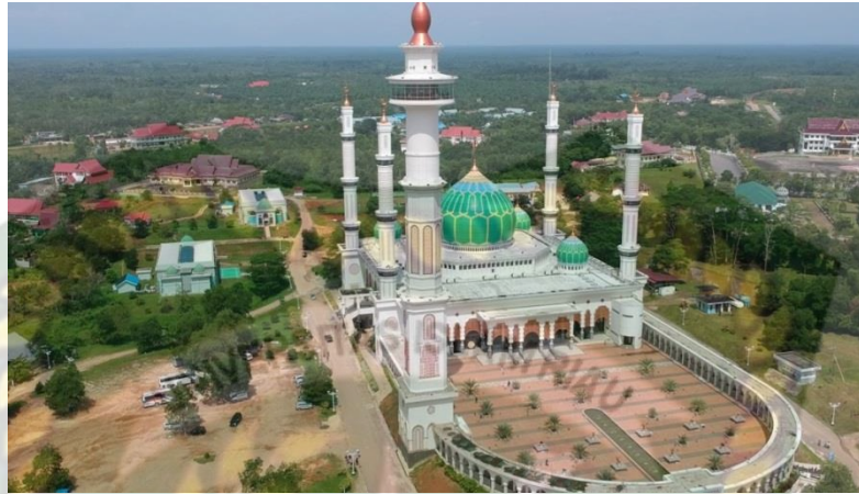
Gambar 4.2 Tampak Masjid Agung Islamic Center dari dalam 2