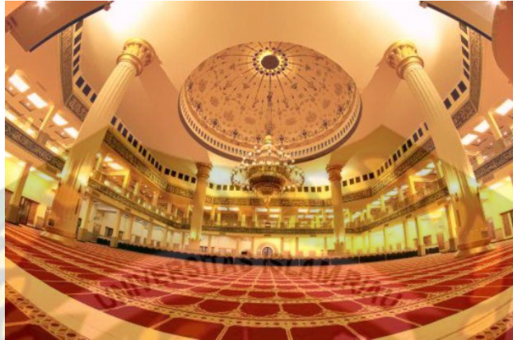
Gambar 4.3 Tampak kemegahan desain Masjid Agung Islamic Center 3