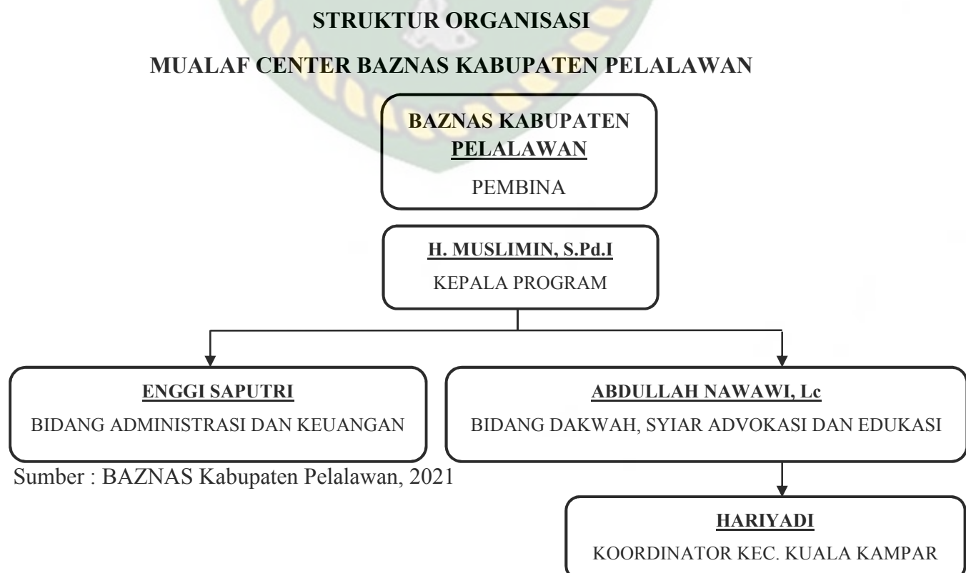
Gambar 4: Struktur Organisasi Muallaf Center BAZNAS (MCB) Tahun 2021