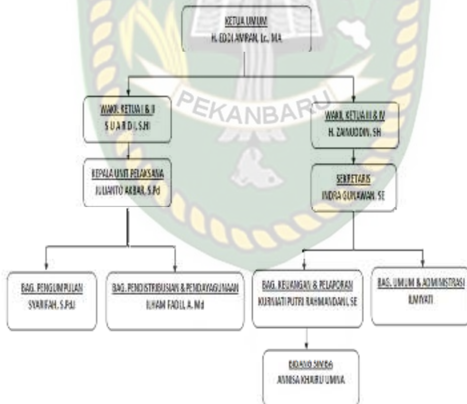
Gambar 3: Struktur Organisasi Badan Amil Zakat Nasional (BAZNAS) Kabupaten Pelalawan Tahun 2021