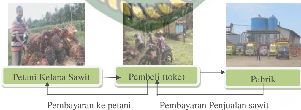
Gambar. 2: Skema jual beli kelapa sawit di Desa Karya Bakti

Berikut ini skema mekanisme jual beli kelapa sawit di Desa Karya Bakti antara petani dan pembeli (toke) sebagai berikut: