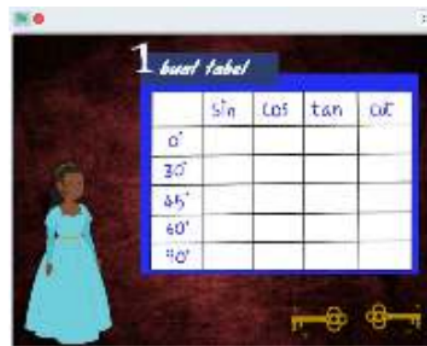
Gambar 2. Cuplikan Materi 2

Setelah melihat media pembelajaran scratch yang diberikan, selanjutnya siswa mengisi angket minat belajar yang terdiri dari 4 indikator. Berikut hasil penelitian dari instrumen non-test yang telah diisi oleh siswa :