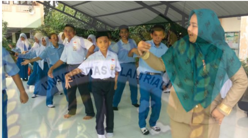
Gambar 17: Kegiatan Mengeksplorasi (1) (Dokumentasi, Leni Putri Handayani 2019)

atau memperagakan sebuah materi pelajaran yang akan mendapatkan apresiasi dalam bentuk penilaian atau evaluasi.