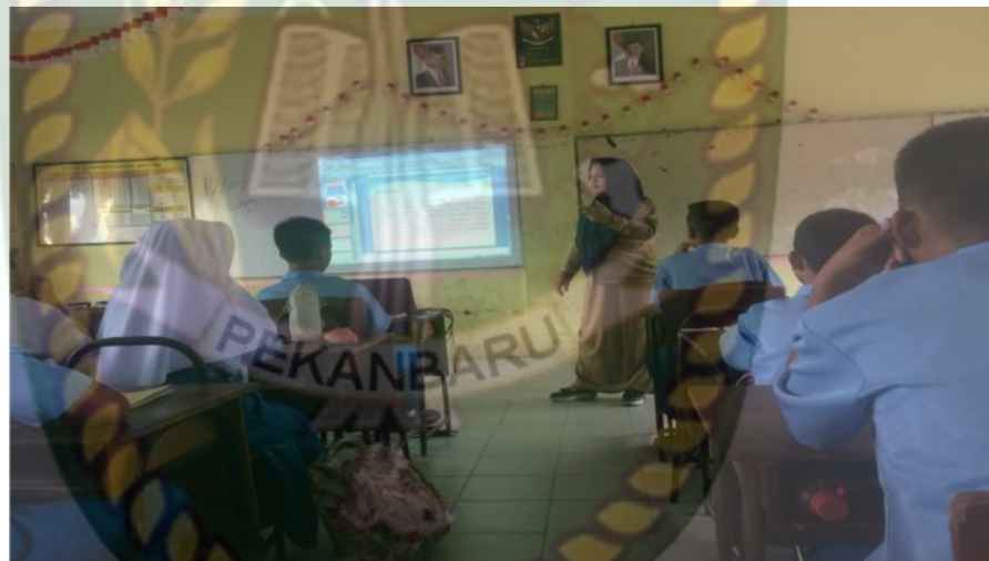
Gambar 11: Kegiatan Menjelaskan Sejarah Tari Kuala Deli