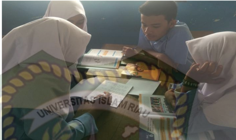
Gambar 9: Kegiatan Mengeksplorasi Pertemuan Kedua