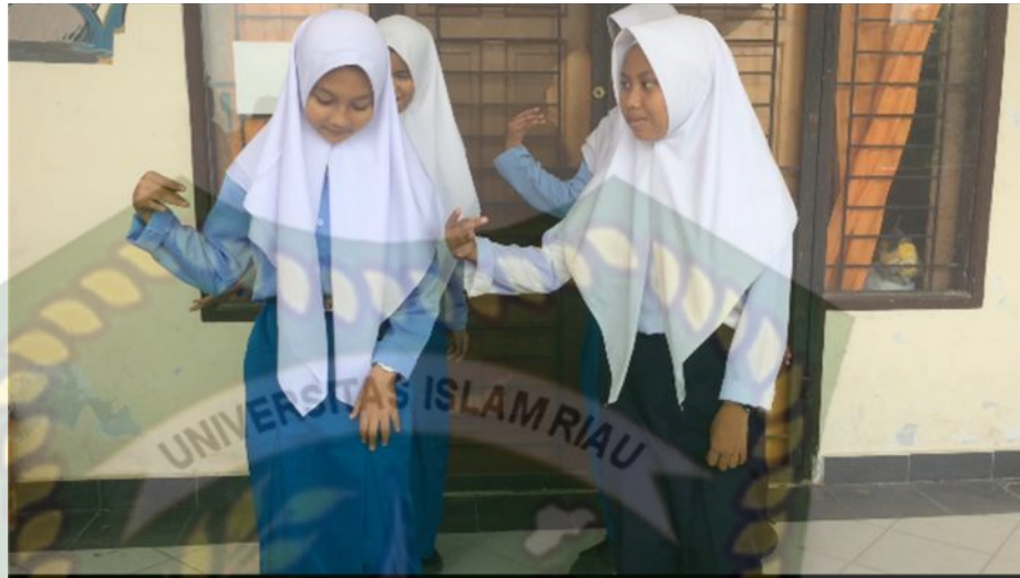
Gambar 14: Kegiatan Mencoba 2 (Siswa Mengesplorasikan Gerak)