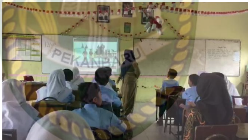
Gambar 7: Kegiatan Mengamati Tari Kuala Deli

Pada pertemuan kedua ini, sebelum memasuki proses belajar mengajar guru melakukan apresiasi sekaligus motivasi kepada siswanya dan mengulang materi pertemuan pertama supaya siswa mulai termotivasi pada awal pelajaran pada pertemuan kedua ini guru memfasilitasi peserta didik untuk melakukan pengamatan, serta melatih mereka untuk memperhatikan, melihat, membaca dan mendengar pada materi yang telah dipersiapkan guru melalui media power point. Pada saat siswa melakukan kegiatan mengamati, siswa terlihat sangat tertarik dan antusias melihat video yang ditampilkan di depan kelas, bahkan siswa meminta guru untuk mengulang hingga beberapa kali untuk mengamati secara detail video tari kuala deli tersebut.