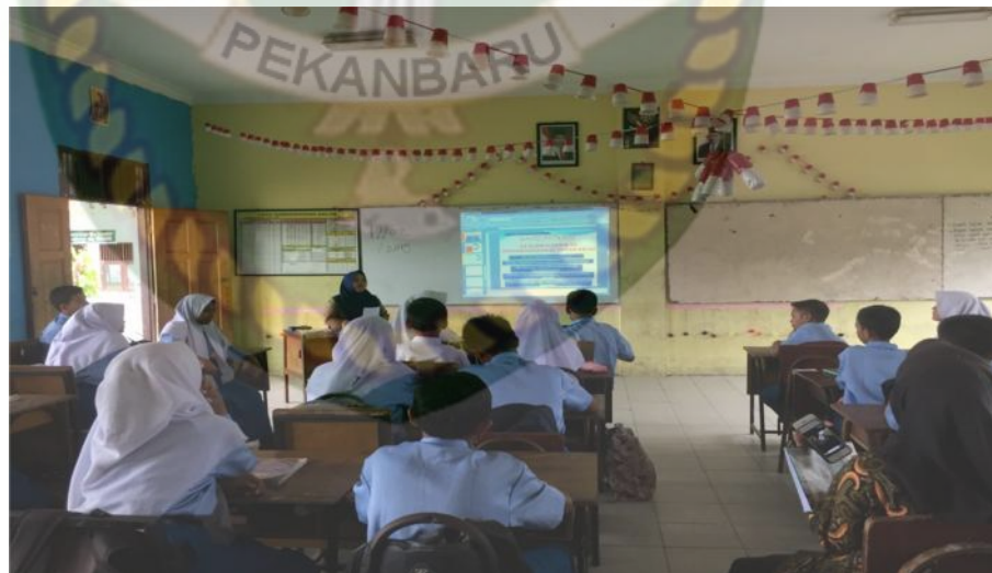
Gambar 8: Kegiatan Menanya Pertemuan Kedua

Setelah mengamati video di atas guru memberi kesempatan kepada peserta didik untuk bertanya mengenai apa yang sudah diamati, disimak, dibaca dan dilihat. Kondisi yang terjadi pada saat proses belajar mengajar berlangsung pada kegiatan menanya memang masih belum seperti yang diharapkan, karena siswa masih belum terbiasa aktif, dan sebagian siswa masih takut dan malu-malu untuk bertanya. Namun, guru selalu memberikan pancingan pertanyaan yang diharapkan mampu membuat siswa mulai berani untuk bertanya. Sehingga kegiatan menanya dapat perlahan membaik dan sesuai dengan yang dituntut dalam kurikulum 2013 ini. Kemudian itu guru mengajukan pertanyaan kepada peserta didik terkait tentang sejarah tari kuala deli yaitu: berasal dari mana tarian itu, jumlah penari, busana apa yang digunakan, musik apa yang digunakan, dan ragam gerak apa saja yang terdapat pada tarian itu.