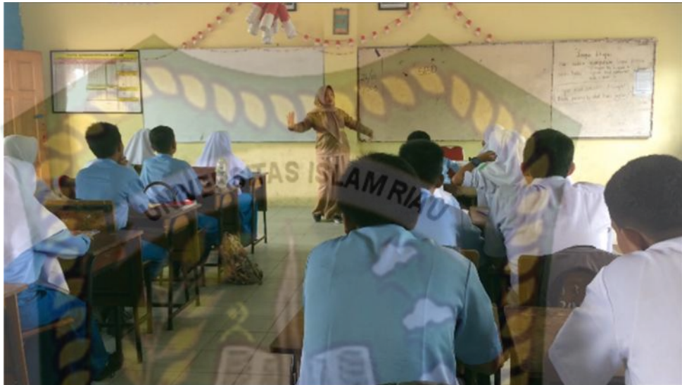
Gambar 15: Kegiatan Mengamati Gerakan Tari Berikutnya

diajarkan kepada peserta didik. Guru meminta kepada peserta didik untuk mempraktekkan gerakan pertama sampai terakhir dengan menggunakan hitungan.