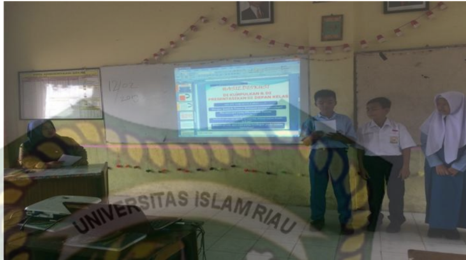
Gambar 10: Kegiatan Mengomunikasikan Sejarah Kuala Deli (Dokumentasi, Leni Putri Handayani, 2019)