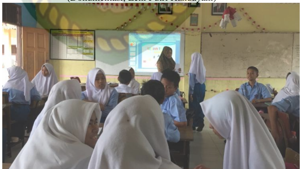
Gambar 5: Kegiatan Mengumpulkan Informasi