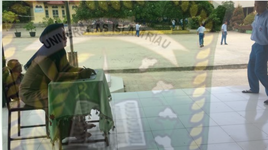
Gambar 19: kegiatan Mengomunikasikan (1)

deli. Kemudian guru langsung memberi nilai praktek kepada kelompok yang telah menampilkan hasil latihannya sebagai apresiasi kepada seluruh kelompok. Dan disini setiap kelompok berlomba-lomba untuk penampilan terbaik didepan kelompok lain.