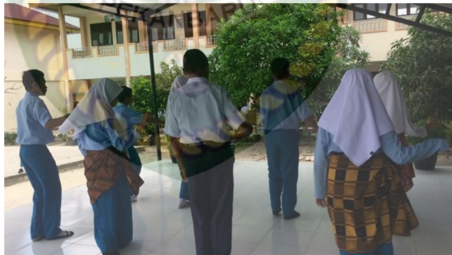
Gambar 20: kegiatan Mengomunikasikan (2)