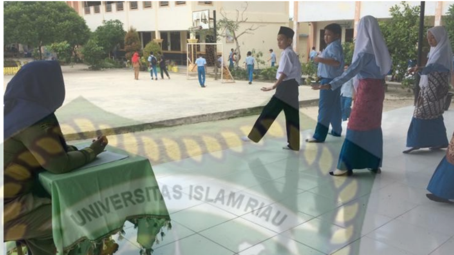
Gambar 21: kegiatan Mengomunikasikan (3)