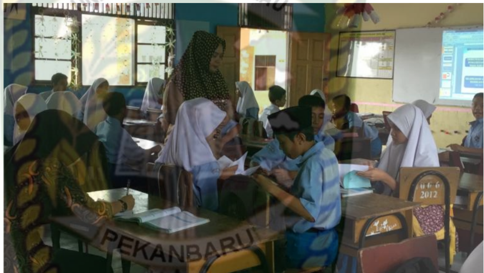
Gambar 4: Kegiatan Mengeksplorasi (Berdiskusi)

permasalahan materi pada pertemuan ini, sedangkan buku paket hanya sebagai penunjang saja. Selain itu guru mengawasi setiap kelompok supaya tidak bermain-main dalam mengerjakan tugas yang telah diberikan. Kemudian setelah selesai berkelompok berdiskusi, setiap kelompok mengumpulkan hasil dari diskusinya kemeja guru.