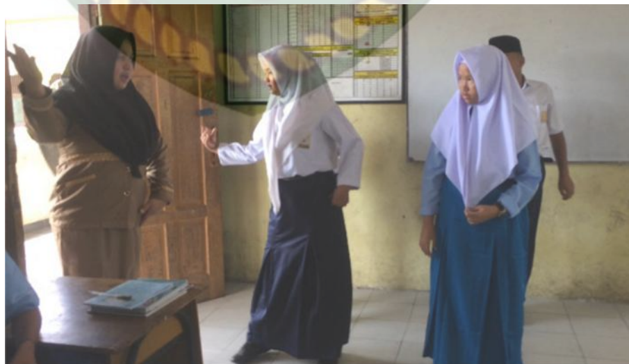
Gambar: 13 Kegiatan Mencoba 1 (Guru Membimbing Siswa) (Dokumentasi, Leni Putri Handayani 2019)

Berdasarkan observasi pada pertemuan ketiga ini peserta didik mencoba menarikan tari kuala deli ragam 1-4 dengan menggunakan hitungan. Setelah guru mempragakan tari kuala deli tersebut, kemudian guru memberi kesempatan kepada peserta didik untuk mencoba dan melatih gerakan tari kuala deli dengan kelompok belajar yang telah di bagikan. Kemudian guru membimbing peserta didik jika mengalami kesulitan-kesulitan dalam mempragakan tari kuala deli ini.