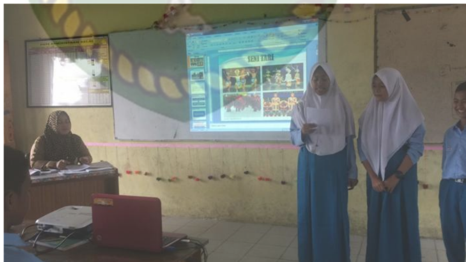
Gambar 6: Kegiatan Mengomunikasikan (Menyampaikan Hasil)

Pada kegiatan mengomunikasikan pada pertemuan pertama ini guru memilih kelompok secara acak untuk mempresentasikan hasil dari diskusi mereka yaitu tentang memahami level dan pola lantai sesuai dengan iringan. Kemudian setiap kelompok menyimpulkan hasil dari diskusinya. Selanjutnya setelah semua kelompok maju kedepan guru mengulang kembali pertanyaan yang diberikan kepada peserta didik supaya peserta didik lebih ingat dan paham tentang materi pada pertemuan pertama ini. Setelah itu guru menjelaskan secara detail tentang level dan pola lantai sesuai dengan iringan dan kemudian guru meluruskan jawaban dari diskusi setiap kelompok yaitu tentang level dan pola lantai sesuai dengan iringan dan kemudian beliau menutup pelajaran.