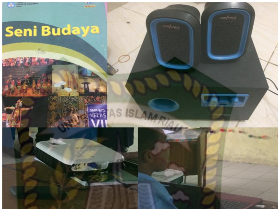
Gambar 23: Sarana dan Prasarana Pembelajaran

Dokumentasi yang dapat penulis simpulkan bahwa sarana dan prasarana yang digunakan dalam pelaksanaan pengajaran seni budaya (tari kuala deli) di SMP Negeri 35 Pekanbaru, oleh guru seni budaya Erma Susilawati yang sesuai dengan Rencana Pelaksanaan Pembelajaran (RPP) adalah media cetak buku siswa, buku guru, LKS berdasarkan kurikulum 2013. Media elektronik laptop, speaker, infokus dan cok sambung.