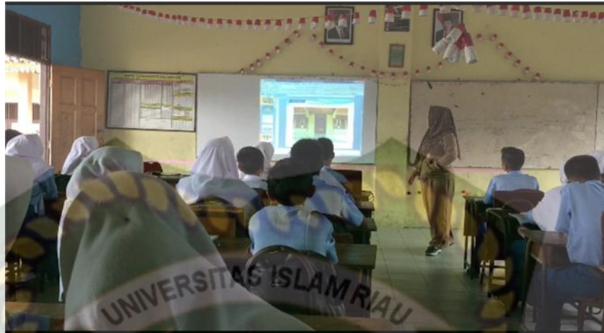
Gambar 2: Kegiatan Mengamati Vidio Tari Pertemuan Pertama (Dokumentasi, Leni Putri Handayani 2019)