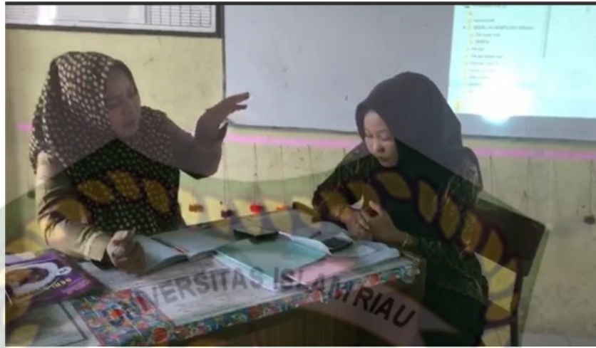
Gambar 1: Wawancara Dengan Guru seni Budaya

Menurut Suryosubroto (2009:23-29), dalam proses belajar mengajar guru harus berpedoman kepada: Kurikulum, Silabus, Rencana Pelaksanaan Pengajaran (RPP), Sarana dan Prasarana dan Evaluasi.