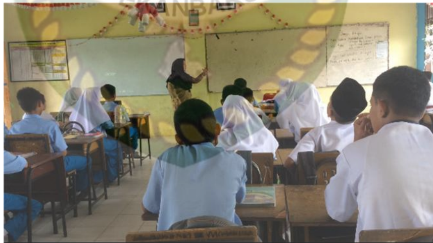
Gambar 12: Kegiatan Mengamati Pertemuan Ketiga

Dalam kegiatan mengamati ini, siswa memperhatikan guru terlebih dahulu mempraktikkan gerak dasar tari kuala deli. Supaya peserta didik lebih paham tentang gerak tari kuala deli tersebut. Dan dengan kegiatan mengamati ini dilakukan dengan tujuan agar peserta didik dapat melihat secara langsung bagaimana objek yang menjadi tolak ukur yang harus dicapai siswa lebih mudah mengerti tentang gerak dasar tari kuala deli ini. setelah mengamati kemudian setiap kelompok belajarnya mencoba gerakan tari kuala tersebut dan dibimbing oleh guru.