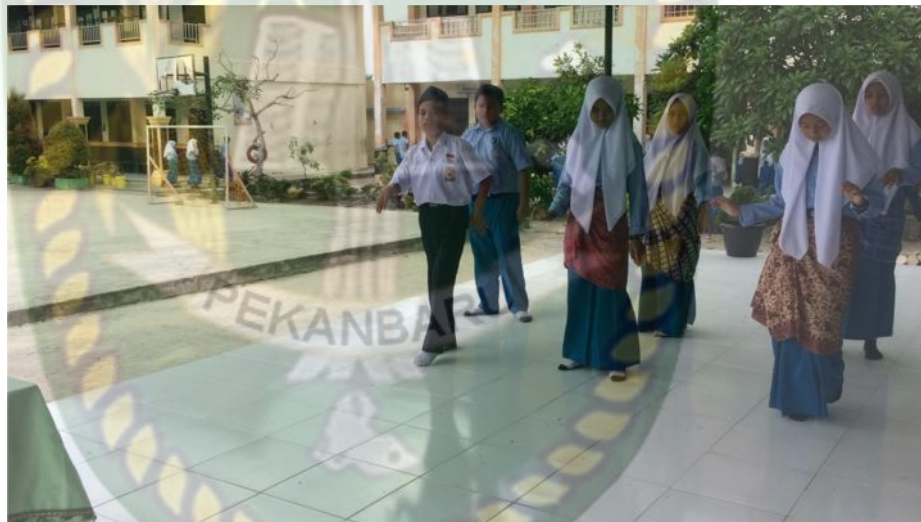
Gambar 22: kegiatan Mengomunikasikan (4)