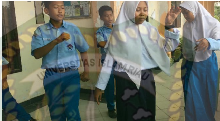
Gambar 16: Kegiatan Mencoba (Siswa Mengeksplorasikan Gerak)

keseluruhan, termasuk membantu mengatasi dan memecahkan masalah-masalah yang akan menghambat pembelajaran.