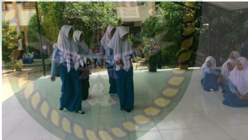
Gambar 18: Kegiatan Mengeksplorasi (2)