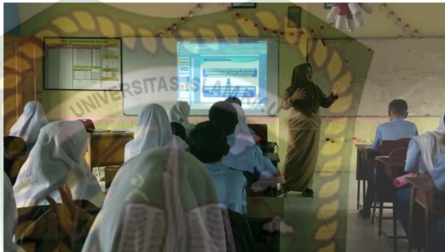
Gambar 3: Kegiatan Menanya Pertemuan Pertama

juga siswa yang antusiasnya dalam bertanya lebih tinggi karena rasa ingin tahunya dalam pembelajaran tari ini.