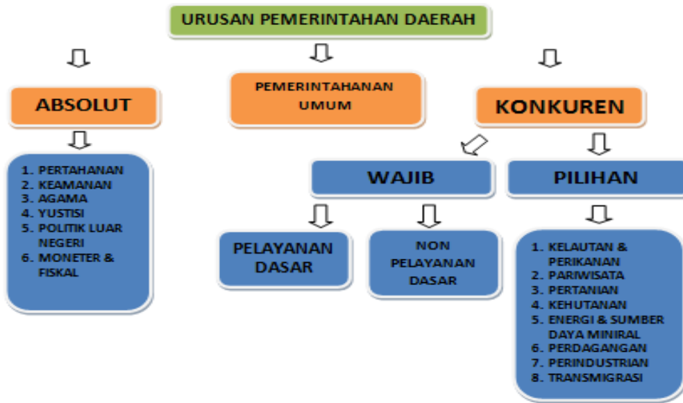
Bagan 1 Klasifikasi Urusan Pemerintahan Daerah

Presiden sebagai kepala pemerintahan. Berikut ini adalah bagan (skema) yang menggambarkan pembagian urusan pemerintahan, sebagai berikut :