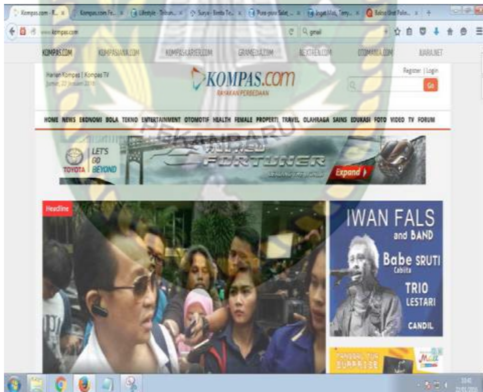
Gambar 4.3 tampilan KOMPAS.com 2015