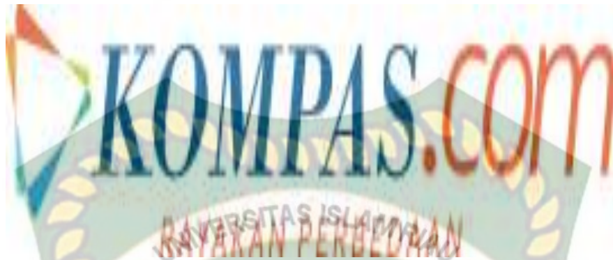
Gambar 4.2 logo Kompas.com