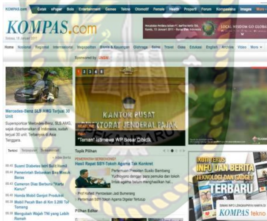
Gambar 4.1 : Tampilan 2011 Situs Berita Kompas.com

Tahun 2013 merupakan tahun perubahan identitas bagi Kompas.com. Perubahan tidak hanya bisa dinikmati pada halaman muka Kompas.com, tetapi juga logo. Berikut beberapa tampilan logo dan tagline Kompas.com dari waktu ke waktu hingga saat ini :