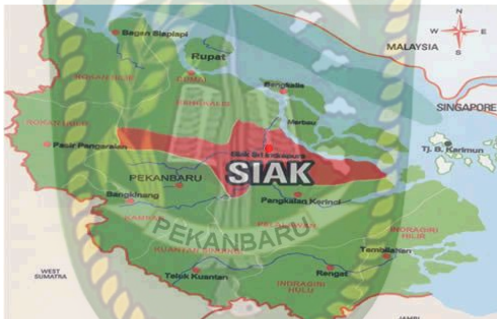
Gambar 4.1 Peta Wilayah Administratif Kabupaten Siak