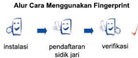
Gambar II.1 : Alur cara menggunakan FingerPrint

Berikut cara menggunakan mesin presensi finger print (sidik jari)