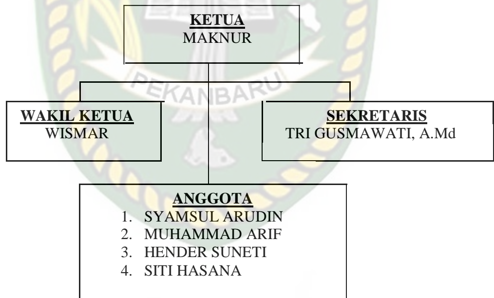
Gambar IV.2 Struktur Organisasi Badan Permusyawaratan Desa (BPD)