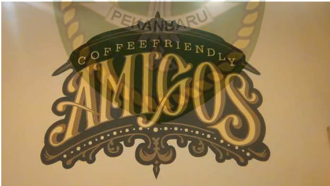
Gambar 4.1. Logo Amigos Café Pekanbaru

Saat ini, para pembeli kopi CV. Tiga Caneca Pekanbaru antara lain adalah Warung Saneza, Tangram Hotel, Premiere Hotel, Swiss-Bellinn SKA, Grand Zuri Hotel Duri, Dhapu Koffie, Grand Elite Hotel, Indiana Kuliner, Grand Zuri Hotel