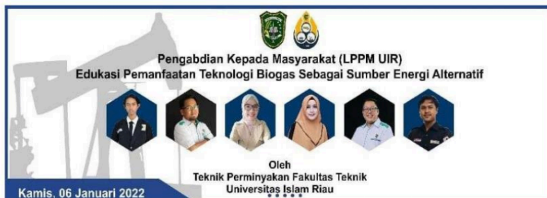
Gambar 1. Spanduk Pengabdian Masyarakat Edukasi Pemanfaatan Teknologi Biogas

Hasil kegiatan tidak langsung dapat dilihat pada saat kegiatan tetapi dari antusias peserta saat mendengarkan presentasi, berdiskusi dapat dilihat bahwa mereka begitu antusiasnya dengan materi yang disampaikan. Mereka aktif bertanya kepada pemateri. Dengan materi yang disampaikan secara terstruktur membuat mereka lebih memahami tentang materi biogas yang disampaikan atau dijelaskan dan dapat menjadi energi alternatif atau energi pengganti yang bisa dimanfaatkan oleh sebagian masyarakat desa Kuala Terusan.