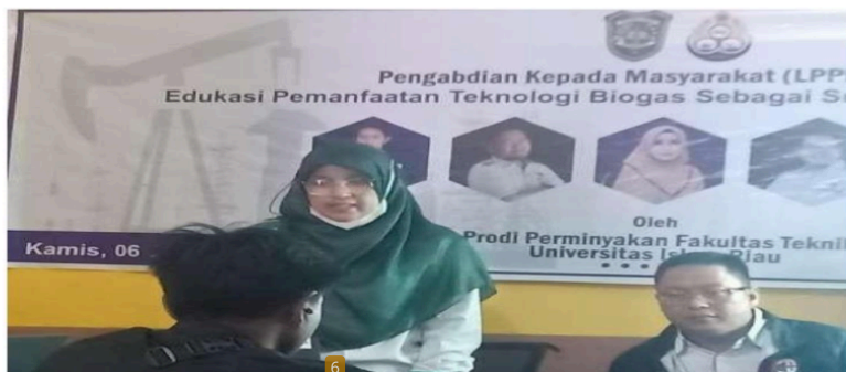
Gambar 2. Penyampaian Materi dari TIM