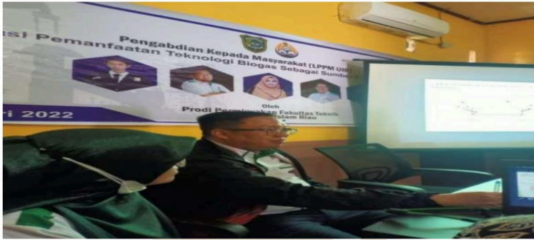
Gambar 3. Penyampaian Materi dari TIM