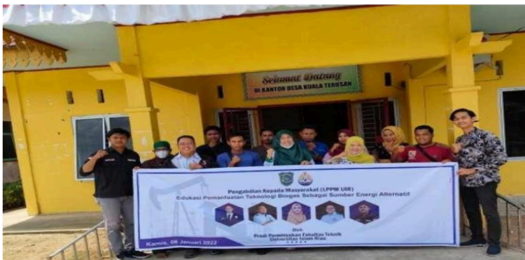
Gambar 5. Foto bersama masyarakat