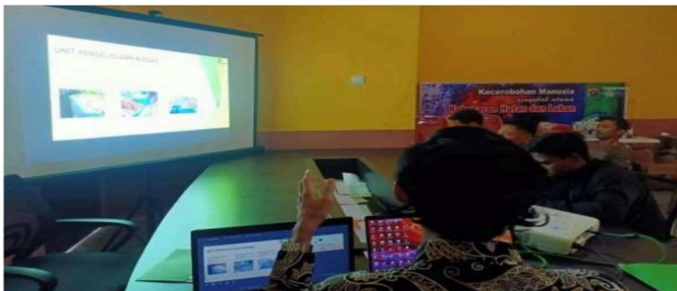
Gambar 4. Penyampaian Materi dari TIM