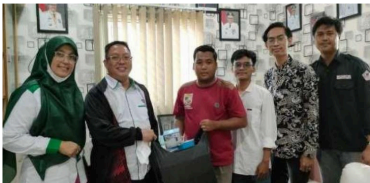
Gambar 6. Penyerahan Cenderamata