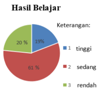
Gambar 3. Hasil Belajar Siswa

Lebih mendetailnya gambaran mengenai Hasil Belajar Siswa secara keseluruhan telah tersajikan pada diagram berikut ini: