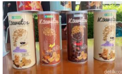
Gambar 5. Contoh kemasan keripik singkong dengan menggunakan bahan kaleng

Berbagai contoh jenis kemasan tersebut, dapat menjadi alternatif inovasi kemasan untuk diadopsi dan digunakan oleh kelompok tani Berkah. Tim kegiatan pengabdian juga telah memberikan solusi penggunaan kemasan yang disesuaikan dengan kondisi keuangan setiap anggota kelompok tani yaitu penggunaan kemasan plastic ziplock. Kemasan jenis ini dianggap kemasan dengan kualitas yang sudah cukup bagus, namun harganya masih bisa dijangkau oleh pelaku usaha keripik singkong. Setyarini & Kristiani (2024) juga memberikan saran kepada pelaku usaha keripik singkong Ibu Tatik di Boyolali dengan menggunakan kemasan Standing Pouch dan Zipper Lock . Hal ini dilakukan dengan tujuan untuk membedakan keripik singkong yang dihasilkan Ibu Tatik dengan pelaku usaha keripik singkong lainnya karena