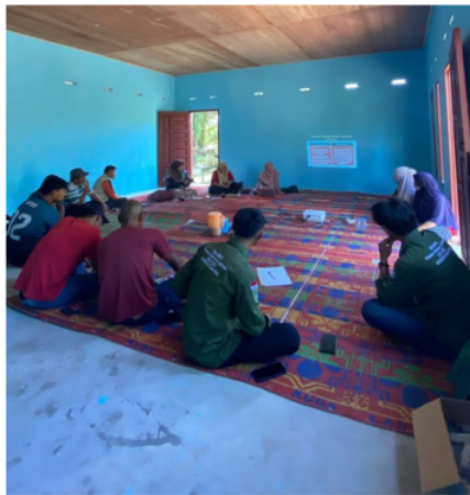
Gambar 1. Pelaksanaan Kegiatan Pengabdian

pengabdian telah memberikan izin kegiatan untuk dilaksanakan pada tanggal 21 September 2023. Kegiatan sosialisasi berlangsung di gedung aula milik kelompok tani berkah. Kegiatan ini dihadiri oleh anggota kelompok tani yang khusus mengolah keripik singkong yaitu sebanyak 8 orang. Kegiatan sosialisasi dan pendampingan pada anggota kelompok tani berkah di Kota Dumai dapat dilihat pada Gambar 1 berikut.