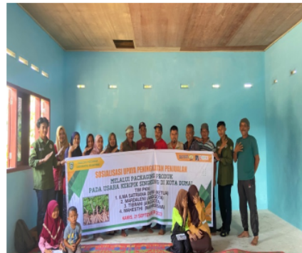
Gambar 7. Foto bersama Kegiatan Pengabdian kepada Masyarakat dengan Mitra Kelompok Tani Berkah

Setelah kegiatan pengabdian berakhir, acara penutup dilakukan dengan pembacaan do'a yang dipimpin oleh anggota mahasiswa. Tidak lupa pula kegiatan foto bersama sebagai arsip dokumentasi kegiatan.