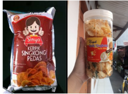
Gambar 4. Contoh kemasan keripik singkong dengan bahan aluminium dan toples plastic mika