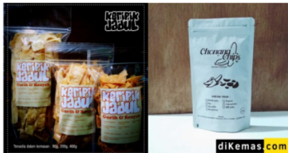
Gambar 3. Contoh kemasan keripik singkong dengan plastik ziplock dan kemasan ziplock berbahan metalize

Kemasan yang baik akan menjaga kualitas produk lebih tahan lama. Kemasan sebaiknya memiliki sifat informatif, mengidentifikasi produk dengan jelas, menyampaikan manfaat dan cara penggunaannya, serta dilengkapi dengan label yang sesuai dengan peraturan tentang label dan iklan. Selain itu, kemasan harus efektif, menarik, dan memudahkan konsumen. Keripik singkong yang dikemas menggunakan kemasan yang baik tentunya dapat diimbangi dengan harga yang sesuai. Sehingga, hal ini tidak hanya dapat meningkatkan penjualan tetapi juga penghasilan pelaku usaha keripik singkong. Inovasi dalam kemasan suatu produk dapat meningkatkan penjualan, karena perhatian utama konsumen terletak pada kemasan yang digunakan. (Bahri et al., 2023). Inovasi desain kemasan juga dapat menjadi strategi krusial dalam meningkatkan penjualan produk (Sakti, 2024). Berikut beberapa jenis kemasan yang dapat digunakan untuk produk keripik singkong yang disampaikan kepada peserta kegiatan.