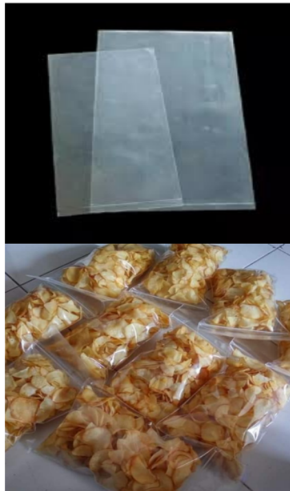
Gambar 2. Contoh kemasan dan keripik singkong yang dikemas dengan kemasan sederhana

Produk keripik singkong dengan kemasan awal yang menggunakan plastik kemasan biasa dapat disesuaikan dengan menggunakan plastik kemasan ziplock dengan menambahkan label merek untuk meningkatkan penjualan. Beberapa jenis kemasan yang dapat digunakan untuk keripik singkong biasanya menggunakan bahan aluminium foil atau metalized (Augustinah & Widayati, 2019). Kemasan untuk keripik singkong termasuk dalam kategori kemasan primer ( consumer pack ), yaitu kemasan yang langsung bersentuhan dengan produk. Umumnya, kemasan ini berukuran relatif kecil dan juga dikenal sebagai kemasan eceran (Augustinah & Widayati, 2019).