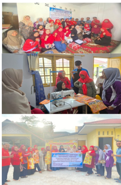
Gambar 7. Pelatihan Pembuatan Celemek

anggota bank sampah. Para peserta mengikuti pelatihan ini dengan penuh semangat dan keseriusan, mulai dari mendengarkan materi, mempraktikkan pembuatan celemek. Pelatihan ini tidak hanya memberikan pengetahuan baru bagi para peserta, tetapi juga membuka wawasan mereka tentang pentingnya pengelolaan sampah plastik secara kreatif dan bernilai ekonomis. Dengan penuh antusias, para peserta mengikuti setiap tahapan pelatihan, yang diharapkan dapat menjadi bekal dalam mengembangkan keterampilan mereka untuk menciptakan produk kerajinan yang memiliki nilai jual. Pelatihan ini juga menjadi ajang untuk mempererat hubungan antar anggota Bank Sampah Puan Sari Mandiri, yang semuanya berbagi tujuan yang sama untuk menciptakan lingkungan yang lebih bersih dan berkelanjutan.