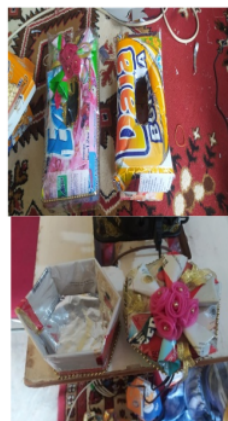
Gambar 4. Pelatihan Kotak Tisu dan Kotak Permen.