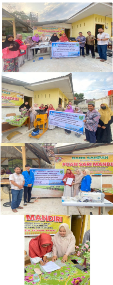
Gambar 6. Serah Terima alat teknologi dari Tim Pengabdian ke Mitra untuk 1 Unit Mesin Jahit merk jack dan 1 Unit Mesin Pencacah Plastik.