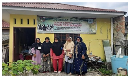
Gambar 2. Tim PKM berkunjung ke Bank Sampah

Kunjungan ini bertujuan untuk melakukan diskusi mendalam guna mengidentifikasi permasalahan yang saat ini dihadapi oleh Bank Sampah. Melalui sosialisasi ini, tim dapat memahami secara langsung kondisi di lapangan serta menggali informasi dari para pengelola mengenai tantangan dan kendala yang dihadapi dalam menjalankan operasional bank sampah. Tim PKM berdiskusi untuk mencari solusi terbaik untuk mitra. Informasi yang diperoleh akan menjadi dasar dalam merumuskan solusi yang tepat dan langkah-langkah selanjutnya dalam program pengabdian ini. Mitra ikut menyamakan persepsi tentang bentuk kerjasama yang ditawarkan dan kesesuaian skema waktu dalam pelaksanaan PKM.