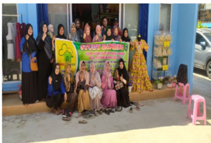
Gambar 3. Tim PKM Foto bersama saat studi tour

motivasi kepada ibu-ibu bank sampah untuk mampu memanfaatkan sampah-sampah menjadi kerajinan tangan yang hasilnya memiliki nilai ekonomi yang tinggi.