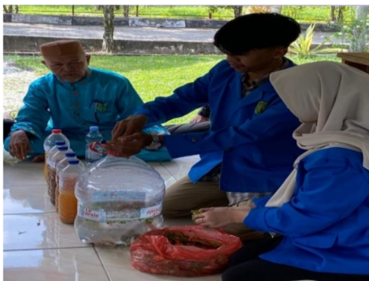
Gambar 2. Praktek Pembuatan Pestisida Nabati

Kemudian, dilakukan kegiatan demonstrasi pembuatan pestisida nabati (eco-enzyme) pada siswa/I magang. Tujuannya agar peserta yang mengikuti kegiatan tidak hanya mendapatkan pengetahuan baru tentang eco-enzyme secara teori namun juga sekaligus dapat mengetahui dalam praktek proses pembuatannya.