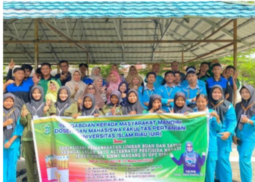
Gambar 3. Foto Bersama Dosen, Kepala UPT, Mahasiswa dan Peserta Kegiatan Evaluasi Kegiatan

Post-test digunakan untuk menilai pemahaman peserta, selain itu untuk mengukur perubahan dalam pemahaman peserta mengenai pemaparan materi yang disosialisasikan. Berdasarkan hasil kuesioner, menunjukkan bahwa adanya kepuasan peserta terhadap tema/judul kegiatan pengabdian ini. Dari 32 orang peserta, 46,9% menjawab sangat puas (15 orang); 46,9% menjawab puas (15 orang); dan 6,2% menjawab cukup puas (2 orang). Ini artinya bahwa kegiatan sosialisasi yang telah dilakukan tepat sasaran.