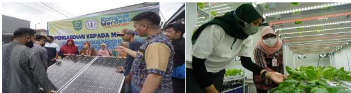
Gambar 2. Edukasi Pengenalan Panel Surya sebagai Sumber Energi Listrik Ramah lingkungan dan Lampu LED Grow Light Sebagai Sumber Cahaya Perangsang Pertumbuhan Tanaman Hidroponik

Lampu LED Grow light merupakan lampu LED yang dibuat khusus untuk percepatan pertumbuhan tanaman, lampu LED yang digunakan pada kegiatan ini yaitu berjumlah 4 buah yang dipasang pada 4 rak hidroponik dengan spesifikasi penggunaan daya sebesar 50 Watt. Lampu LED Grow Light merupakan inovasi terbaru dalam teknologi pertanian, inovasi ini bertujuan untuk mempercepat proses pertumbuhan tanaman sehingga produktivitas pemilik dalam memanen tanaman pertanian akan semakin meningkat 2 sampai 3 kali lipat.