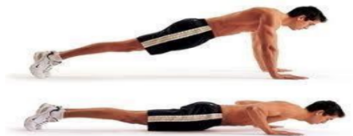
Gambar 3. Push-Up (Pasaribu, (2020; 26–27).