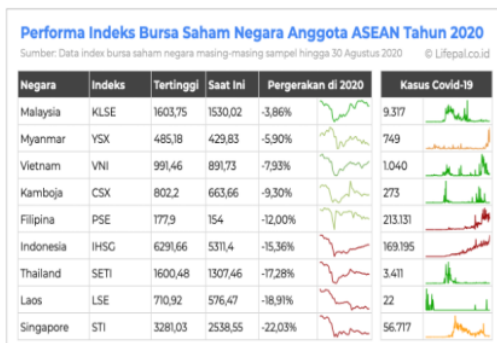
Gambar 1. Performa Indeks Saham Negara ASEAN Pasca Covid-19

Hal tersebut agar penyebaran virus dapat dibatasi namun masyarakat yang dirumah juga tetap produktif. Sebuah survei literatur yang diusulkan oleh Goodall J.W. Resources Lett (2020) me-32)jukkan bahwa Pertimbangan sepenuhnya dampak ekonomi dari bencana alam (seperti perang, perubahan iklim, atau bencana lokal), dan ditekankan bahwa pandemi COVID-19 menyebabkan perlambatan ekonomi dan dapat menyebabkan kerugian ekonomi global yang belum pernah terjadi sebelumnya. Perlambatan ini sudah terlihat pada 63)us beberapa negara yang memasuki resesi. Pada kuartal II 2020, produk domestik bruto (PDB) mengalami pertumbuhan negatif, seperti Singapura. Sentimen negatif dari kebijakan tersebut telah menyebabkan reaksi pasar yang berlebihan sehingga adanya perubahan pada performa indeks bursa saham di n43)ra-negara anggota ASEAN tahun 2020, untuk lebih jelasnya dapat dilihat pada gambar dengan grafik berikut: