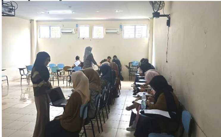
Gambar 2. Pendampingan pembuatan liveworksheet.com (Jumat, 31 Mei 2024)

mampu mengaplikasikannya secara praktis, menghasilkan LKPD berkualitas tinggi yang siap digunakan dalam proses pembelajaran.