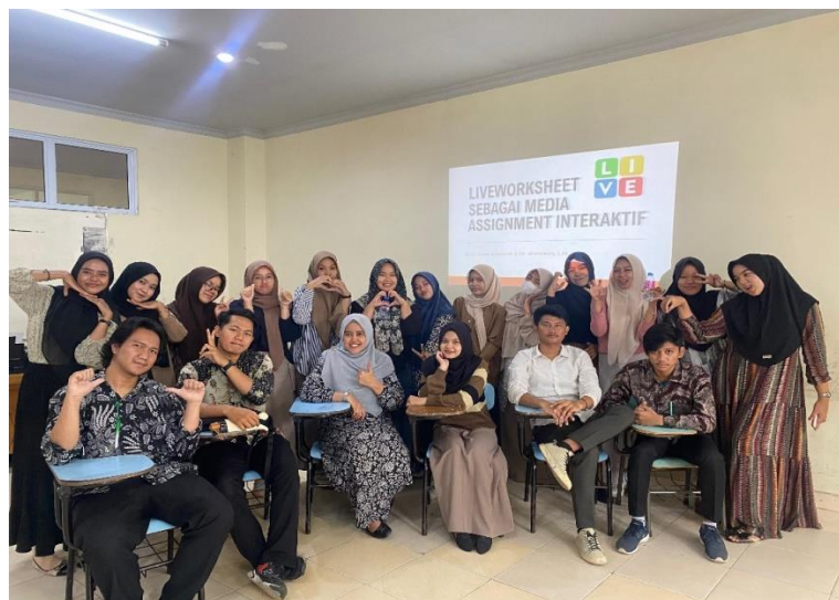
Gambar 3. Foto bersama peserta PkM dan Tim PkM

Tim pendamping, terdiri dari dosen dan mahasiswa yang memiliki keahlian dalam penggunaan teknologi pendidikan dan pembuatan LKPD, dibentuk dengan peran dan tanggung jawab yang jelas. Sosialisasi kegiatan dilakukan melalui media sosial, poster, dan pengumuman di lingkungan kampus untuk menarik minat mahasiswa, dan pendaftaran peserta dilakukan secara online untuk memudahkan proses administrasi. Dengan perencanaan yang matang, kegiatan pengabdian ini berjalan lancar, dan semua tahapan selanjutnya dapat mencapai tujuan yang diinginkan secara efektif.