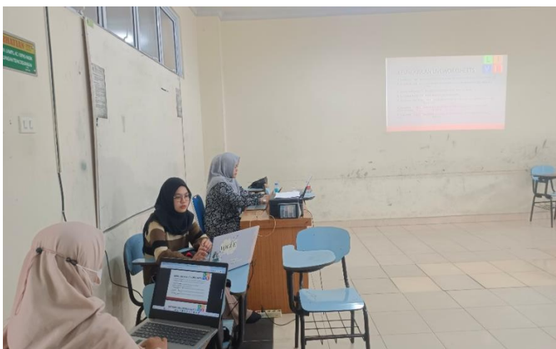
Gambar 1. Tahap Pelatihan membuat LKPD (Jumat, 31 Mei 2024)

Tahapan pelatihan diawali dengan pemberian pemahaman mendalam tentang platform Liveworksheet, di mana mahasiswa belajar menggunakan berbagai fitur seperti drag and drop, checkboxes, dan soal interaktif lainnya. Pelatihan ini mendorong kreativitas mahasiswa dalam merancang LKPD yang menarik dan interaktif, serta memberikan mereka kesempatan untuk mempraktikkan pengetahuan yang diperoleh melalui sesi praktik langsung. Evaluasi berkala dilakukan untuk memonitor perkembangan, dengan mahasiswa menyusun beberapa LKPD sebagai tugas yang dievaluasi oleh tim pendamping. Sesi diskusi dan tanya jawab rutin diadakan untuk membahas pengalaman dan tantangan yang dihadapi mahasiswa, memungkinkan mereka untuk saling berbagi pengetahuan dan solusi.