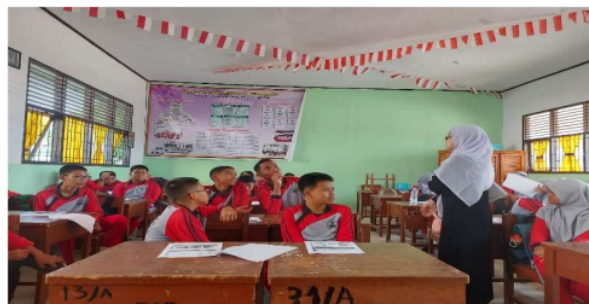
Gambar 1. Dialog interaktif antara pemateri dan siswa

Sesi kedua yaitu pemaparan materi yang berlangsung kurang lebih selama 60 menit. Tim kegiatan pengabdian menyampaikan materi tentang program pemerintah yang bertajuk #BijakBersosmed. Pada kesempatan sesi kedua ini, beberapa materi yang dibahas antara lain dampak negatif media sosial, kriminalitas di media sosial, prinsip-prinsip bermedia sosial, panduan bermedia sosial, cara menghindari hoax , contoh berita hoax , dan cara mengidentifikasi kredibilitas informasi online. Kegiatan pemaparan materi dilakukan secara interaktif, para siswa memberi tanggapan dengan sangat bersemangat pertanyaan-pertanyaan pancingan yang diberikan oleh pemateri.