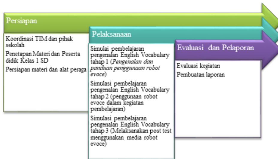
Gambar 3. Metode Pelaksanaan PKM di SMP Negeri 37 Pekanbaru