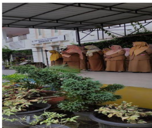
Gambar 2. Foto Kepala Sekolah SMP Negeri 37 Pekanbaru Memberikan Pengarahan

Data yang ditemukan dari hasil wawancara, observasi dan FGD dengan kepala sekolah Ibu Indrawati, M.Pd pada tanggal 6 Juni 2023 diperoleh informasi bahwa, pertama, guru khususnya bahasa Inggris dalam proses pembelajaran menggunakan media yang sudah ada dari tahun ke tahun. Hal ini disebabkan kurangnya sarana dan prasarana