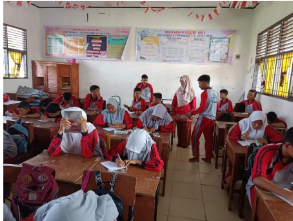
Gambar 5. Simulasi tahap 2