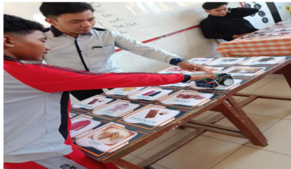
Gambar 6. Simulasi tahap akhir

Pada tahap implementasi akhir, khususnya Tahap 3, tim pelaksana melakukan evaluasi terhadap kemampuan siswa ditinjau dari penguasaan kosakata yang telah diperolehnya dengan menggunakan materi pembelajaran berbasis Evoce Robot, dengan harapan akan terjadi peningkatan penguasaan kosakata dibandingkan sebelumnya.