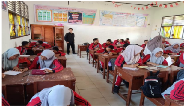
Gambar 4. Simulasi tahap 1 dengan pengambilan data awal

Pada simulasi Tahap 1 ini, tim pelaksana PKM yang terdiri dari instruktur dan siswa melakukan sesi pelatihan singkat tentang cara penggunaan robot Evoce sebagai sarana pembelajaran bahasa Inggris. TIM menjelaskan cara kerja robot, cara memprogramnya, dan berbagai jenis aktivitas yang dapat dilakukan dengan menggunakan Evoce Robot . Selain itu, pada fase pertama ini, tim memberikan tes awal kepada siswa tentang penguasaan kosakata mereka saat ini.