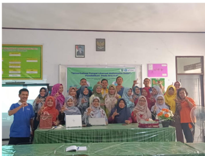
Gambar 7. Evaluasi Kegiatan PkM dengan tim Sekolah SMP Negeri 37 Pekanbaru