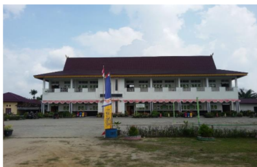
Gambar 1. Foto Halaman SMP Negeri 37 Pekanbaru

SMP Negeri 37 Pekanbaru beralamat di Jalan Garuda Ujung Desa/Kelurahan Tengkerang Tengah Kecamatan Marpoyan Damai Kota Pekanbaru. No. SK. Pendirian No. 72 Tahun 2014 dan tanggal SK. Pendirian adalah 17-02-2014. Sekolah mitra yang ditunjuk tim pengabdian merupakan sekolah negeri yang terkenal di Pekanbaru dengan beragam aktifitas kegiatan sekolah. Dengan total jumlah siswa dari kelas 1 sampai kelas 3 sebanyak 762 merupakan jumlah yang sangat tinggi. Guru yang mengajar sesuai dengan bidang studi berjumlah 6 orang guru laki-laki dan 37 orang guru perempuan. Fasilitas belajar ruang kelas sebanyak 14 (kelas 1- kelas 3), ruang laboratorium sebanyak 2 labor yaitu labor komputer dan labor bahasa serta 1 ruang perpustakaan dan banyak lagi fasilitas penunjang lainnya.