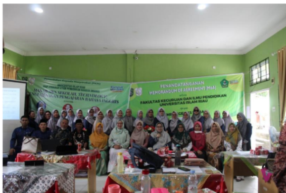
Gambar 4. Foto Bersama dengan guru-guru dan Kepsek SMP Negeri 13 Dumai

Berikutnya adalah sesi tanya jawab seputar aplikasi yang telah diperkenalkan. Pada sesi ini para peserta diberikan kesempatan untuk menanyakan hal-hal yang masih menjadi kendala ataupun yang belum dipahami oleh para peserta. Kegiatan pendampingan ini diakhiri dengan melakukan foto bersama dengan para guru mitra di dalam aula SMP Negeri 13 Dumai .