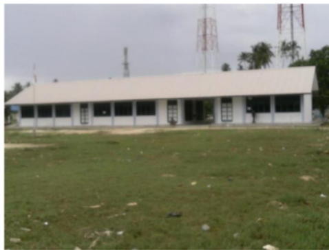
Gambar 1. Halaman Sekolah SMP Negeri 13 Dumai

Implikasi dari manajemen pendidikan adalah bahwa otoritas terbesar diberikan kepada pemerintahan yang berada pada tingkat kabupaten dan kota sebagai tangan pemerintah pusat yang diberi mandat untuk mengatur jalannya pendidikan sesuai dengan sumber daya manusia yang ada di kabupaten dan tentunya sesuai dengan kebutuhan daerahnya masing-masing, dan adanya perubahan wewenang pengelolaan diharapkan dapat meningkatkan kinerja secara profesional dalam bidang perencanaan dan pelaksanaan pada setiap bidang kerja di kabupaten.