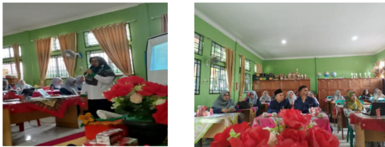
Gambar 3. Pemateri dan Peserta PKM sedang menyajikan dan fokus pada materi yang diberikan

Berikutnya adalah sesi tanya jawab seputar aplikasi yang telah diperkenalkan. Pada sesi ini para peserta diberikan kesempatan untuk menanyakan hal-hal yang masih menjadi kendala ataupun yang belum dipahami oleh para peserta. Kegiatan pendampingan ini diakhiri dengan melakukan foto bersama dengan para guru mitra di dalam aula SMP Negeri 13 Dumai .