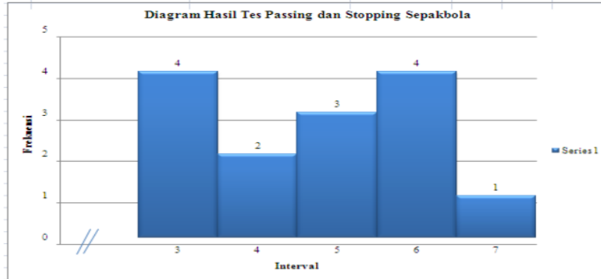
Grafik 3. Histogram Frekuensi Skor Variabel Y Pada Pemain SSB U-14 Nongsa Football Training Batam

Penyebaran distribusi frekuensi dari hasil passing dan stopping sepakbola dapat ditunjukkan pada gambar berikut: