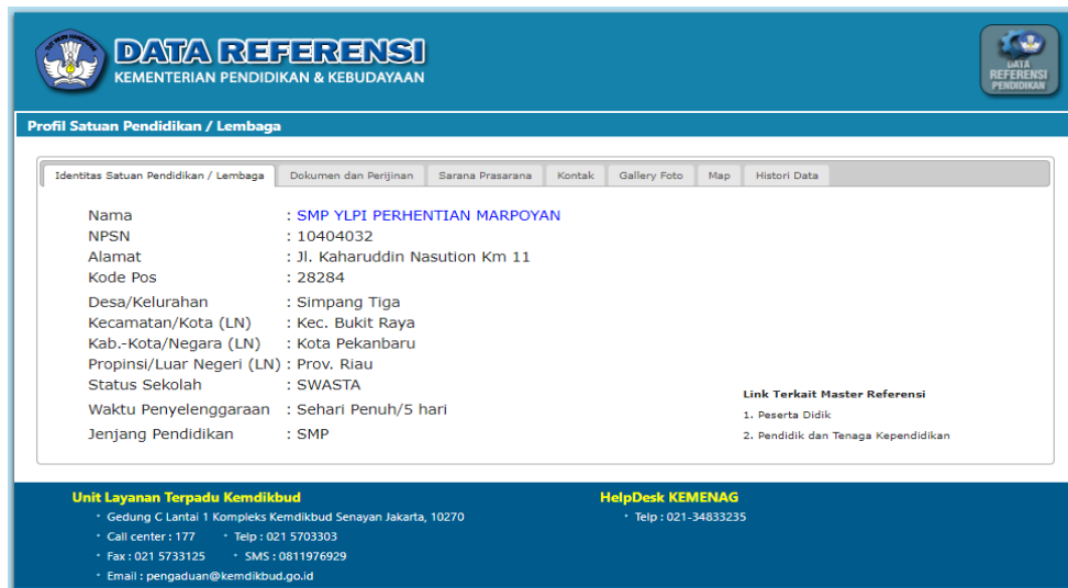
Gambar 1. Data Referensi Kemendikbud

SMP YLPI Marpoyan adalah sekolah swasta dibawah naungan yayasan YLPI (Yayasan Lembaga Pendidikan Islam). Tahun 1957, YLPI Daerah Riau diaktekan dengan Akte Notaris Syawal St. Diatas No. 10/1957. Landasan mendasar dari YLPI dalam prinsipnya adalah: "Berbuat Baiklah, sebagaimana Allah telah berbuat kepada mu." (Al-Qhasas:77). YLPI menaungi tidak hanya SMP tapi dari semua tingkat level sekolah telah dibangun sampai ke perguruan tinggi yaitu Universitas Islam Riau.