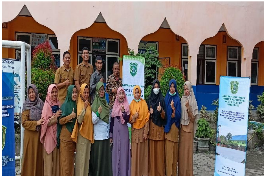
Gambar 4. Foto Bersama dengan guru-guru SMP YLPI Marpoyan