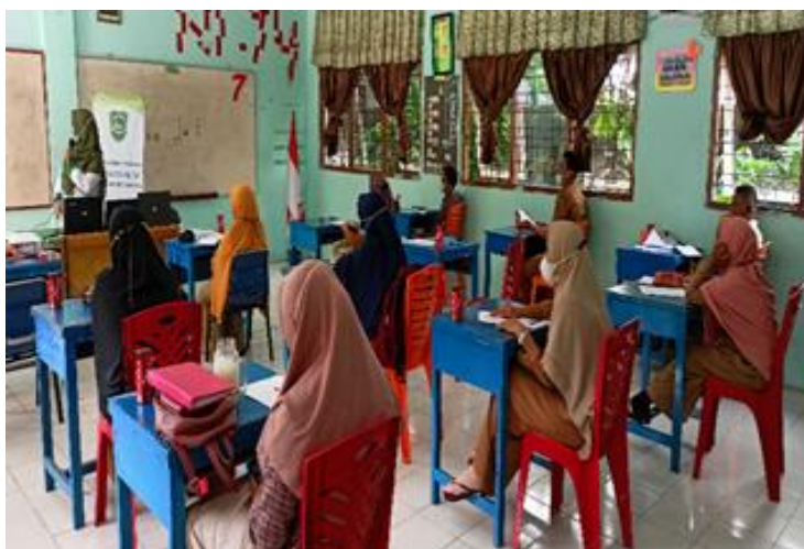
Gambar 3. Para guru-guru Mitra fokus pada materi yang diberikan

Dasar pertimbangan dari solusi yang ditawarkan berupa kegiatan ceramah, pelatihan dan pendampingan untuk Peningkatan Kualitas Pembelajaran Melalui Pendampingan pelatihan Digital Storytelling selama masa covid-19. Gambar dibawah adalah sesi pendampingan terhadap para guru-guru mitra dimana para guru memperhatikan langsung materi yang disampaikan oleh pemberi materi.