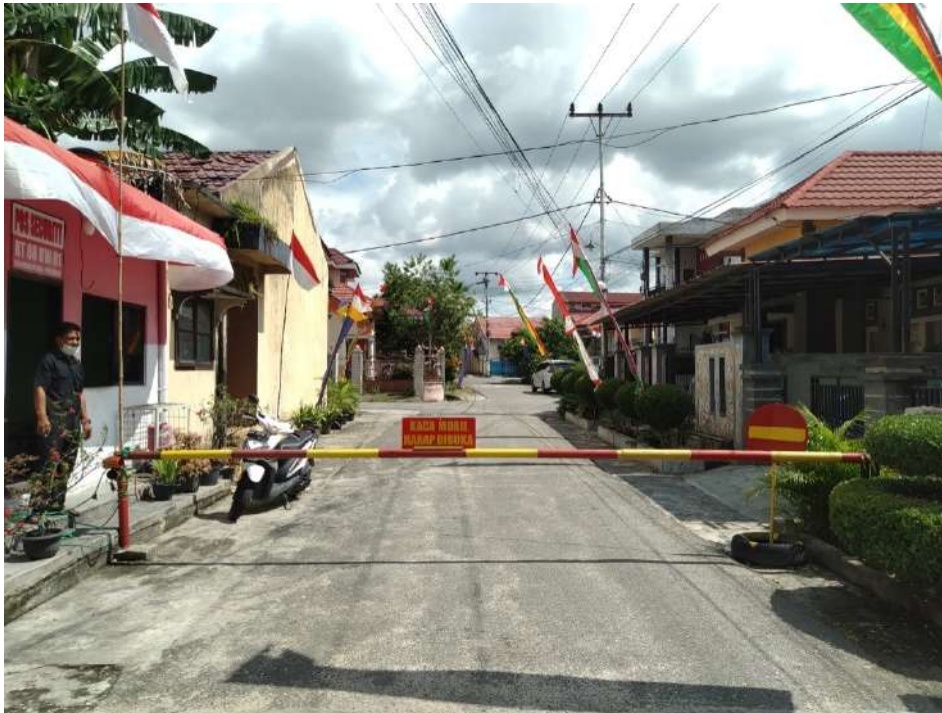
Gambar 5.27 Image perumahan Nuansa Gria Flamboyan