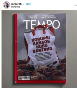
Gambar 7.

Penggunaan simbol organisasi seperti simbol partai politik menurut Santoso et al., (2014) menjelaskan bahwa korupsi merupakan kejahatan korporasi dan berjamaah yang melibatkan banyak orang. Hal ini sejalan dengan Fikri (2018) di mana kejahatan korupsi membutuhkan mitra untuk memperkuat relasi kuasa dan dukungan dalam membentuk formasi politik.