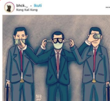
Gambar 6.

Penggunaan simbol seperti gestur dan pakaian dalam merepresentasikan kejahatan korupsi, menurut Kasmuri (2017) digunakan karena tampilan koruptor selalu identik dengan tampilan masyarakat kelas atas. Di mana koruptor seringkali direpresentasikan dengan kemewahan, integritas, dan hak istimewa privilege untuk mendapatkan akses (Haq, 2015). Oleh sebab itu, korupsi merupakan kejahatan yang dilakukan oleh kelompok lapisan yang memiliki kuasa atas struktur kelompok dibawahnya (Wahyuni, 2019; Febrianto, 2020).