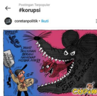
Gambar 3.

Penggunaan simbol binatang dalam mendiseminasikan kejahatan korupsi oleh pengguna media sosial Instagram juga dapat dilihat melalui tampilan gambar 3 yang diunggah oleh pengguna media sosial Instagram bernama @coretanpolitik. Dimana kejahatan korupsi digambarkan dengan tampilan binatang seperti tikus dengan mulut terbuka berlidahkan hantu, dengan mata yang tajam menghadap pada orang bertubuh kecil, memakai topi, tameng bertuliskan KPK, dan juga memegang kertas bertuliskan "Ott Nurdin Abdullah" "Yang Triliunan Berani Nangkap Nggak Nih" "Kasus Korupsi Di Asabro & Jiwasraya"