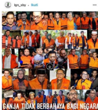
Gambar 4, sumber Instagram.

Dalam media sosial Instagram, kejahatan korupsi sering diseminasi secara simbolik melalui beberapa tampilan meme dengan menggunakan bahasa sindiran, dan simbol identitas tertentu. Hal tersebut dapat dilihat melalui tampilan gambar 4 yang diunggah oleh akun media sosial Instagram bernama @lgn_sby. Dimana kejahatan korupsi digambarkan melalui tampilan beberapa wajah aktor seperti pejabat institusi negeri dengan mengenakan rompi oranye dan menunjukkan gestur berwibawa, santun, dan tenang yang juga memuat teks bertuliskan “Ganja Tidak Berbahaya Bagi Negara.” Penggunaan simbol identitas seperti pejabat negeri dalam merepresentasikan kejahatan korupsi, menurut Argiyo (2013) menunjukkan bahwa kejahatan korupsi hanya dapat dilakukan oleh aktor yang memiliki kemampuan dan relasi kuasa untuk memanfaatkan sumber daya yang ada.