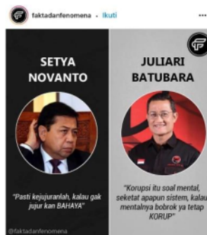
Gambar 9 , sumber Instagram.

Penggunaan simbol kelompok dalam mendiseminasikan kejahatan korupsi oleh pengguna media sosial Instagram juga dapat dilihat melalui tampilan gambar 9 yang diunggah oleh akun pengguna media sosial Instagram bernama @faktadanfenomena. Di mana kejahatan korupsi digambarkan dengan tampilan politisi negara seperti Setya Novanto dan Juliari Batubara yang berpenampilan rapi berkemeja. Gambar meme tersebut juga memuat beberapa teks yang bertuliskan “Pasti Kejujuranlah, Kalau Gak Jujur Kan Bahaya” dan “Korupsi itu soal mental, seketat apapun sistem, kalau mentalnya bobrok ya tetap Korup”