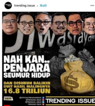
Gambar 5, sumber Instagram.

Penggunaan simbol identitas dalam mendiseminasikan kejahatan korupsi oleh pengguna media sosial Instagram juga dapat dilihat melalui tampilan gambar 6 yang diunggah oleh pemilik akun Instagram bernama @bhck_.. Di mana kejahatan korupsi digambarkan dengan tampilan beberapa aktor laki-laki dengan penampilan rapi mengenakan jas dan dasi seperti pengusaha dan pejabat. Tampilan tersebut juga menunjukkan aktor yang memakai kacamata dan masker sedang menutup bagian mulut dan mata dari aktor lain menggunakan selembar kertas seperti uang sedangkan aktor lainnya menutup telinga aktor tersebut dengan kertas yang sama.