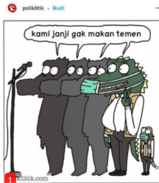
Gambar 2.

Penggunaan simbol binatang seperti buaya dalam merepresentasikan kejahatan korupsi, merujuk atas persamaan sikap antara koruptor dan binatang buaya. Sama seperti koruptor, binatang buaya juga dikenal berperilaku ganas, rakus, licik, dan tamak, sehingga perilaku buruk dari binatang buaya tersebut tidak jarang menjadi rujukan bagi pengguna media sosial Instagram untuk menjadikan binatang buaya sebagai simbol kejahatan korupsi (Widyatmoko, 2014; Nouriani, 2011; Simangunsong, 2018).