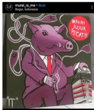
Gambar 1.

Dalam konteks media sosial Instagram, kejahatan korupsi seringkali diseminasi secara simbolik melalui beberapa tampilan meme dengan menggunakan bahasa sindiran, simbol binatang yang unik dan lucu. Hal tersebut dapat dilihat melalui tampilan gambar 1 yang diunggah oleh akun pengguna media sosial Instagram bernama @mural_is_me . Dimana kejahatan korupsi digambarkan melalui tampilan seekor binatang seperti babi dengan perut buncit dan mata yang tajam sedang memegang tumpukan kertas di atas sebuah bangunan bertuliskan KPK, sambil membawa sebatang rokok yang asapnya membentuk seperti hantu, dan juga memuat teks bertuliskan “Berani Jujur Pecat!!!”. Penggunaan simbol binatang seperti babi dalam merepresentasikan kejahatan korupsi, menurut Levisen, (2013) dikarenakan perilaku binatang tersebut cenderung membawa kerusakan dan juga berperilaku tamak, sehingga binatang tersebut tidak jarang menjadi musuh bagi manusia.