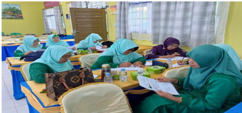
Gambar 2. Guru-Guru Madrasah Mengikuti Pelatihan

sumber daya alam bagi kelangsungan hidup. Menyadari berbagai persoalan tentang generasi muda, pemerintah selama 15 tahun ke depan secara serius mengembangkan pendidikan budaya dan karakter bangsa, melalui jalur pendidikan, baik pada jenjang pendidikan dasar dan menengah maupun jenjang pendidikan tinggi (Kumiawan, Nugroho, & Perdana, 2019; Lestari, & Bahri, 2021).