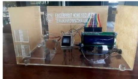
Gambar 2. Rancangan arsitektur system pengaman rumah dengan Arduino

Bagian ini menjelaskan usulan arsitektur sidik jari biometrik untuk keamanan rumah. Komponen arsitekturnya adalah sensor sidik jari, papan mikrokontroler, door lock dan tampilan LCD 16X2. Gambar 2 mengilustrasikan arsitektur rancangan sistem keamanan rumah beserta komponennya.