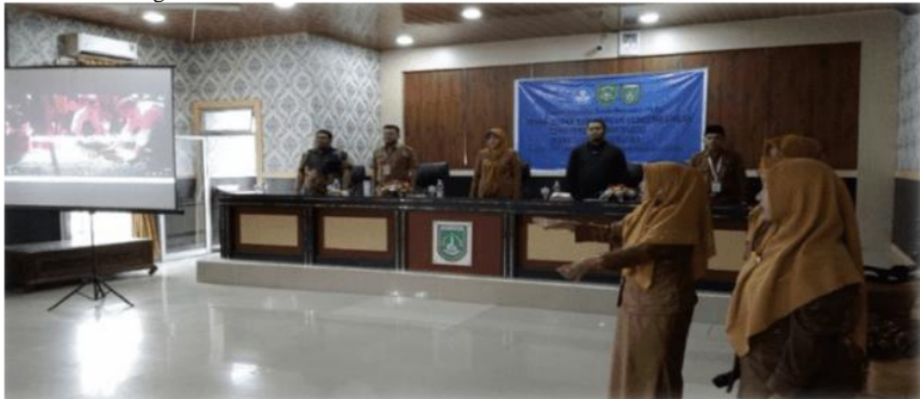
Gambar 2. Pembukaan

Pembukaan kegiatan pelatihan dan pengenalan media pembelajaran digital berbasis android ini dilaksanakan pada pukul 08.30 s.d 09.00. Kegiatan ini dibuka oleh MC