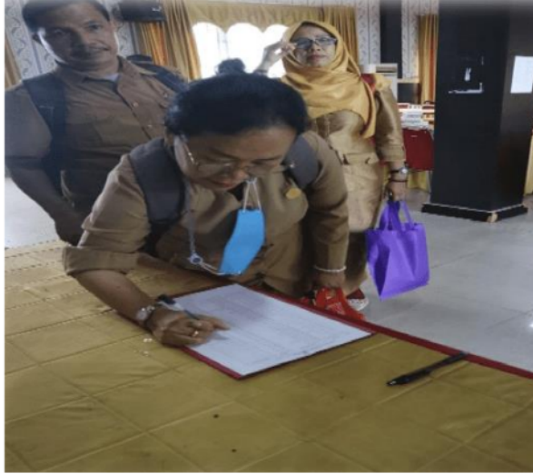
Gambar 7. Absensi Peserta Di Hari Kedua

Pada pukul 08.00 s.d 08.15 merupakan jadwal kedatangan peserta pelatihan Peningkatan Kemampuan Pengembangan Media Pembelajaran Digital Berbasis Etnomatika. Sesi ini kembali meminta peserta untuk mengisi absen kehadiran.