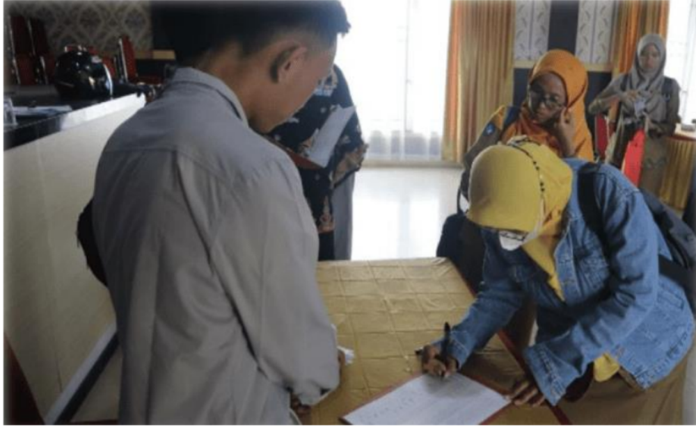
Gambar 1. Kedatangan dan Registrasi Peserta

Di hari pertama ini pada pukul 08.00 s.d 08.30 adalah kedatangan dan registrasi peserta pelatihan. Pada kegiatan ini pula dibagikan modul pelatihan serta ATK yang akan digunakan dalam pelatihan ini.