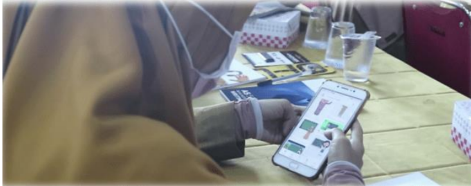
Gambar 14. Praktek Pembuatan Media Pembelajaran Digital

Pelatihan ini tidak hanya diberikan materi kosong, namun panitia dan seluruh komponen pelaksana mengharapkan ada sesuatu yang dibuat dan dibawa pulang oleh peserta pelatihan. Dalam hal ini peserta pelatihan diharuskan membuat media pembelajaran digital menggunakan aplikasi yang telah diajarkan oleh pemateri dengan materi pembelajaran matematika yang diinginkan berbasis etnomatika. Penyediaan modul pelatihan juga menjadi salah satu bantuan yang dapat digunakan oleh peserta dalam menerapkan penggunaan aplikasi InShot ataupun SAC.