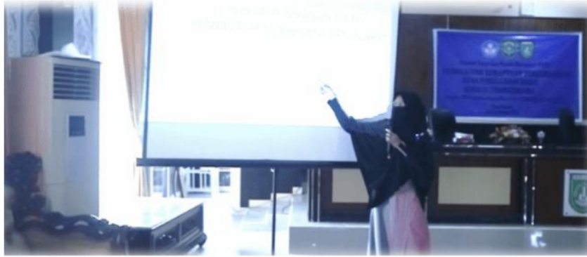
Gambar 10. Pemberian Materi Kelima oleh Dila Anggaraini, S. Pd

Materi terakhir yang didapati peserta adalah Media Pembelajaran Digital berbantuan Aplikasi SAC yang disampaikan oleh Dila Anggaraini, S.Pd selama 150 Menit. Materi ini disampaikan dalam dua tahap, yaitu tahap pertama pukul 09.20 s.d 10.10 WIB berisikan materi pengenalan, untuk nantinya dilanjutkan pada praktek pembuatan media pembelajaran digital menggunakan SAC pada tahap kedua pukul 10.20 s.d 12.00 WIB.