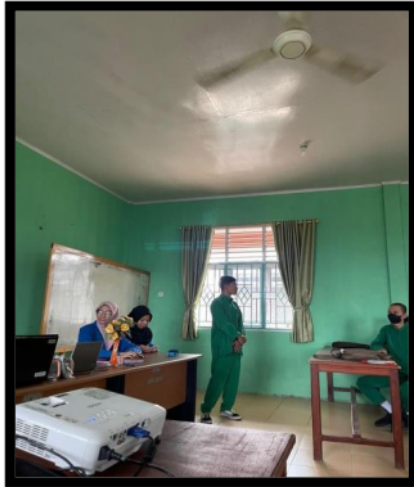
Gambar 5. Respon Siswa

Descriptive tentang diri sendiri dan sebagainya. Pemateri telah menyajikan materi-materi tersebut dalam tayangan menggunakan aplikasi CANVA. Siswa mampu merespon setiap latihan-latihan yang diberikan.