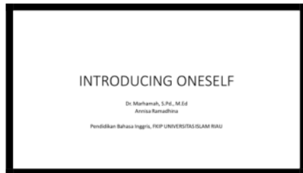
Gambar 2. Materi Bahasa Inggris

Canva. Tahapan berikutnya, peserta telah belajar dengan menggunakan CANVA. Materi yang disajikan CANVA tersebut berupa kegiatan keterampilan berbahasa Inggris seperti mendengar, berbicara, membaca dan menulis. Peserta kegiatan PkM dapat dengan mudah menggunakan aplikasi CANVA di telepon Android atau smartphone mereka masing-masing.