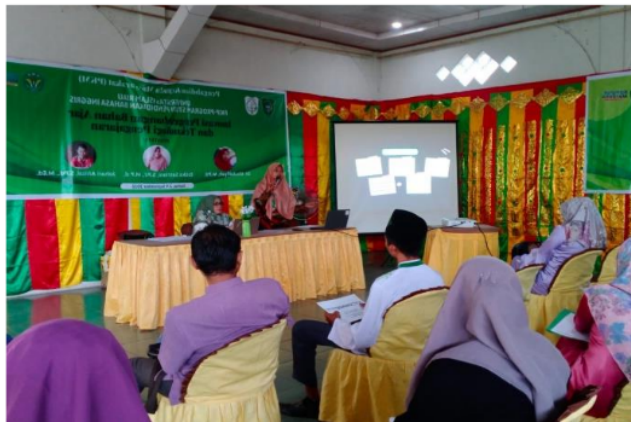
Gambar 1. Pemaparan Materi oleh Pelaksana

Adapun materi yang dalam kegiatan yang berlangsung selama 7 hari yaitu 02 September 2022 sampai dengan 09 September 2022 meliputi: