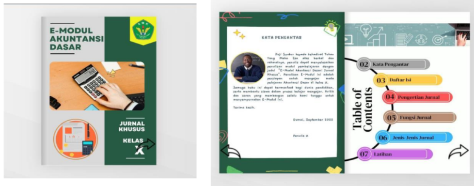
Gambar 3. Contoh Hasil Karya E-Modul Pembelajaran oleh Guru SMKS Budi Dharma Dumai