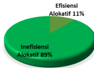
Gambar 2. Proporsi Efisiensi dan Inefisiensi Alokatif Petani Karet di Kecamatan Tapung Hulu Tahun 2018

Berdasarkan Gambar 5.2 dapat dijelaskan bahwa sebanyak 11 persen petani karet efisien secara alokatif dan ada sebanyak 89 persen petani karet yang inefisien. Nilai efisiensi alokatif berkisar antara 0 dan 1. Nilai efisiensi alokatif yang terkecil sebesar 0.62, yaitu petani sampel ke-28 dan nilai efisiensi alokatif petani yang tertinggi sebesar 1 sebanyak 6 petani, yaitu petani sampel ke 9, 21, 22, 24, 36 dan 37. Nilai efisiensi teknis rata-rata petani karet sebesar 0.87 persen.