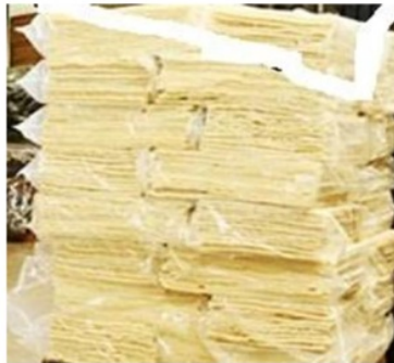
white crep / pale crep