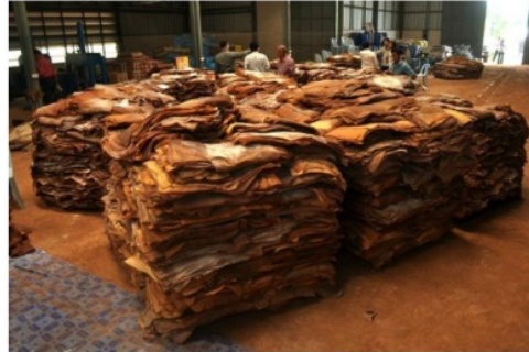
Gambar 1. Ribbed Smoked Sheet

Dengan adanya spesifikasi teknis dinaksud, maka keuntungan yang dapat dirasakan dari TSNR dibandingkan dengan