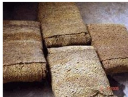
compo crep / estate brown crep