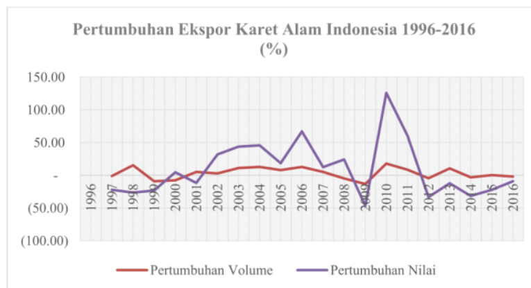
Gambar 3. Pertumbuhan Ekspor Karet Alam Indonesia 1996-2016

peningkatan harga-harga komoditas termasuk karet alam sehingga nilai ekspor karet alam Indonesia meningkat tajam sebesar 125.93 persen (4,44 milyar US$). Untuk melihat gambaran pertumbuhan volume dan nilai ekspor karet alam Indonesia dapat dilihat pada gambar 3.