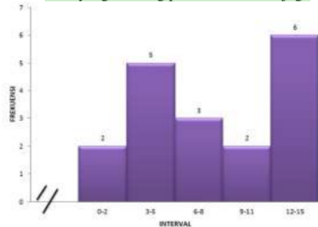
Grafik 2. Histogram Hasil Koordinasi Mata dan Kaki pada Atlet Club FC Bentra Benyah.

Data yang tertuang pada tabel di atas juga digambarkan dalam bentuk grafik histogram berikut ini.