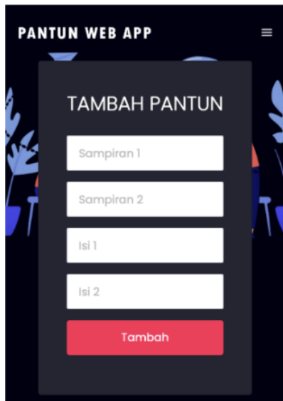
Gambar. 6 Tampilan Antarmuka Fitur Tambah Pantun (Output)