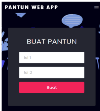
Gambar. 3 Tampilan Antarmuka Fitur Buat Pantun (Input)