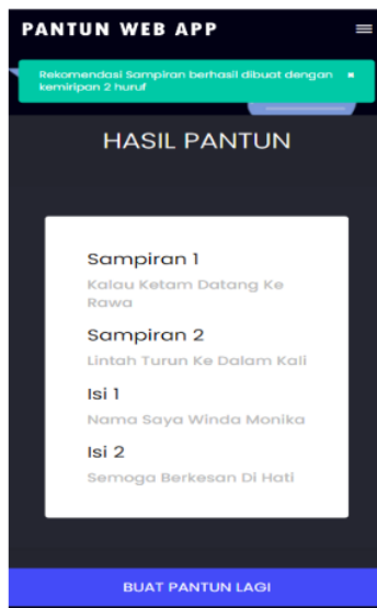
Gambar. 4 Tampilan Antarmuka Fitur Buat Pantun (Output)

Adapun workflow atau rangkaian kerja sistem rekomendasi untuk fitur “Tambah Pantun” seperti yang terlihat pada Gambar 5. antara lain.