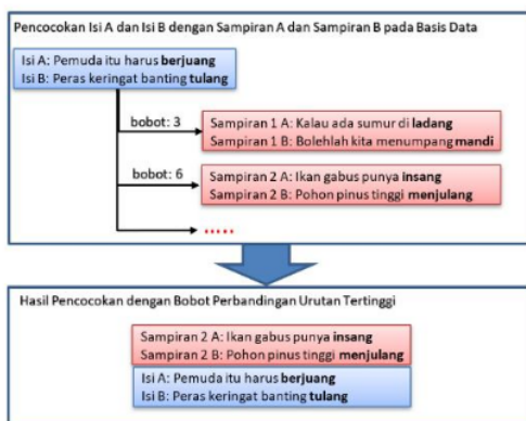
Gambar. 1 Pencocokan Rima Isi dengan Sampiran Pantun dari Basis Data

pantun 1 ialah 3. Sedangkan bobot sampiran pantun 2 ialah 6 dengan masing-masing bobot sampiran 2 A ialah 3 dan bobot sampiran 2 B ialah 3.