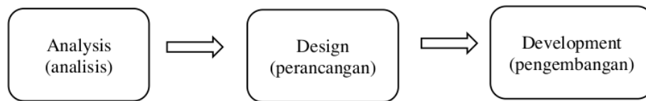
Gambar 1. Modifikasi Langkah-Langkah Pengembangan Model ADDIE

Jenis penelitian yang dilakukan adalah penelitian pengembangan Research and Development (R&D). Model pengembangan yang digunakan berupa model ADDIE yaitu Analysis (analisa), Design (perancangan), Development (pengembangan), Implementation (pelaksanaan), dan Evaluation (evaluasi). Menurut Tegeh & Kirna (2013) bahwa model pengembangan ADDIE disusun secara terprogram dengan urutan-urutan sistematis dalam upaya pemecahan belajar yang berkaitan dengan sumber belajar yang sesuai kebutuhan dan karakteristik pembelajaran. Hal ini sejalan dengan pendapat Nadiyah & Faaizah (2015) yang menyatakan bahwa salah satu fungsi ADDIE adalah menjadi pedoman untuk membangun perangkat dan infrastruktur program pelatihan yang efektif, dinamis, dan mendukung kinerja pelatihan itu sendiri. Langkah-langkah pengembangan ADDIE selanjutnya dimodifikasi sesuai dengan kebutuhan peneliti menjadi: analysis (analisis), design (perancangan), dan development (pengembangan)