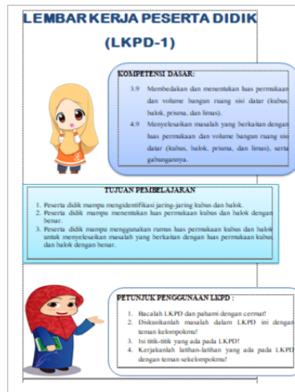
Gambar 4. Produk Akhir LKPD

Hasil pengembangan perangkat pembelajaran ini berupa RPP dan LKPD dengan Model TSTS telah teruji kevalidannya dan dapat dilanjutkan untuk tahap ujicoba supaya dapat diketahui kepraktisan dan keefektifannya. Pernyataan ini dikuatkan oleh hasil penelitian Khulsum, Hudiyono, & Sulistyowati (2018); Zagoto & Dakhi (2018) yang menyatakan bahwa supaya produk akhir dapat digunakan untuk proses pembelajaran di kelas.