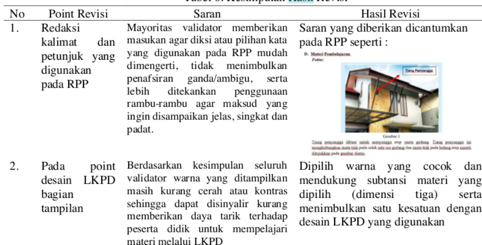
Tabel 6. Kesimpulan Hasil Revisi

Bagian hasil dan pembahasan menyajikan hasil-hasil yang diperoleh dan cara pencapaiannya. Uraian harus komprehensif namun tetap ringkas dan padu.