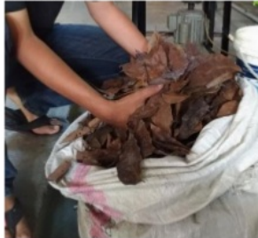
Gambar 4 Daun sebelum dicacah