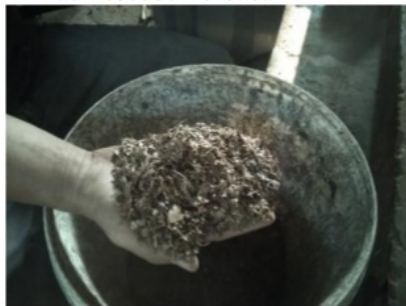
Gambar 5 Daun yang telah dicacah