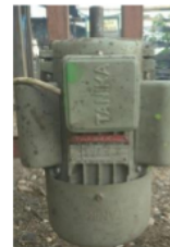
Gambar 2 Motor penggerak