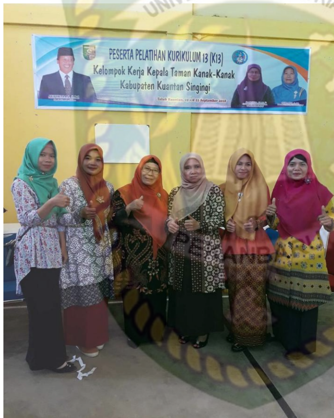
Gambar 4 : pelatihan yang diberikan oleh dinas yang diikuti oleh guru-guru

Sedangkan menurut Standar Operasional Prosedur Dinas pendidikan pemuda dan Olahraga Permendiknas 42 tahun 2009 tentang standar pengelola pada Kursus dan Pelatihan yang tercantum dalam isinya bahwa pengelola kursus dan pelatihan sangat penting dalam memelihara keberlangsungan kegiatan pembelajaran pada lembaga kursus dan pelatihan akan tetapi Dinas masih lemah dalam memberikan pelatihan terhadap Lembaga, sehingga Lembaga sebagian masih tidak berkembang.