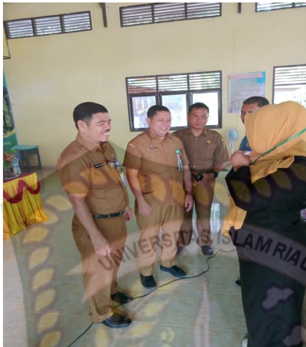
Gambar 3 : Dinas memberikan pengarahan berbentuk pengawasan

Gambaran di atas membuktikan bahwa Dinas telah melakukan pengaran dengan cara mengawasi.