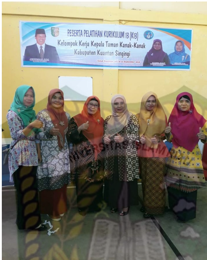
Gambar 2 : bimbingan yang berbentuk pelatihan

Gambar diatas bisa dilihat bahwa Dinas Pendidikan Pemuda Olahraga telah melakukan sebuah bimbingan yang berbentuk pelatihan. Sesuai dengan yang diungkapkan pak Eddi Spd selaku kepala Seksi pembinaan kursus dan pelatihan.