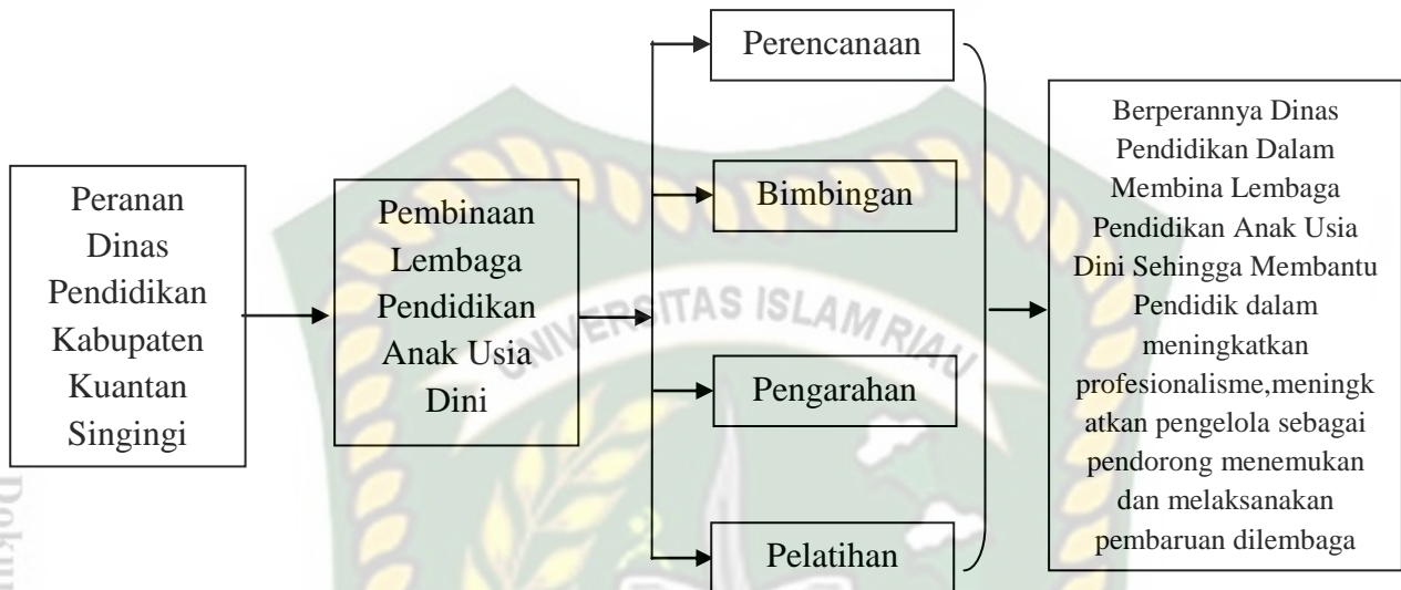
Gambar II.I: kerangka pikiran Pembinaan Lembaga Pendidikan Anak Usia Dini Desa Koto Tinggi Dan desa Padang Tanggung Kecamatan Pangean Kabupaten Kuantan Singingi