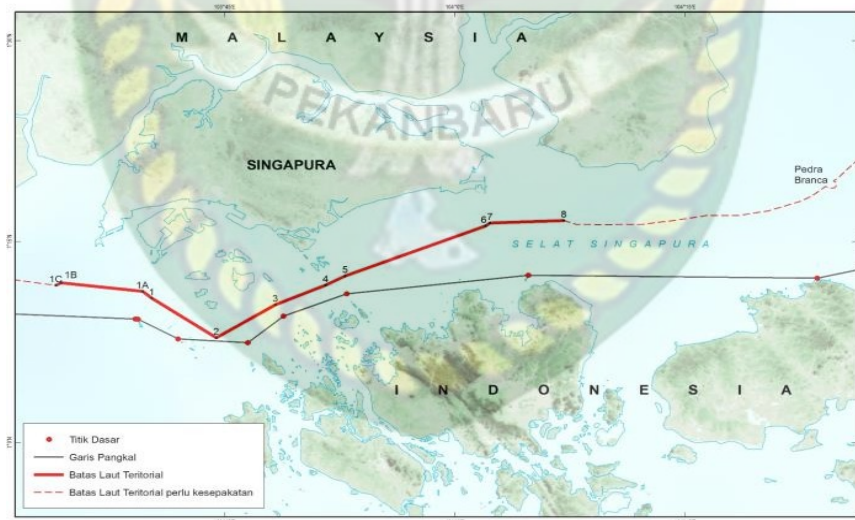
Gambar 1. Batas Maritim Indonesia-Singapura di Selat Singapura

Berikut adalah gambar hasil kesepakatan batas maritim Indonesia dengan Singapura :