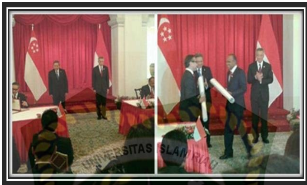
Gambar 1. Penandatanganan Perjanjian antara Republik Indonesia dan Republik Singapura tentang Penetapan Garis Batas Laut Wilayah di Bagian Barat Selat Singapura.

Penetapan garis batas laut wilayah di bagian Barat Selat Singapura antara Republik Indonesia dan Republik Singapura pada dasarnya telah memberikan keuntungan bagi Republik Indonesia dalam berbagai aspek, yaitu: 107