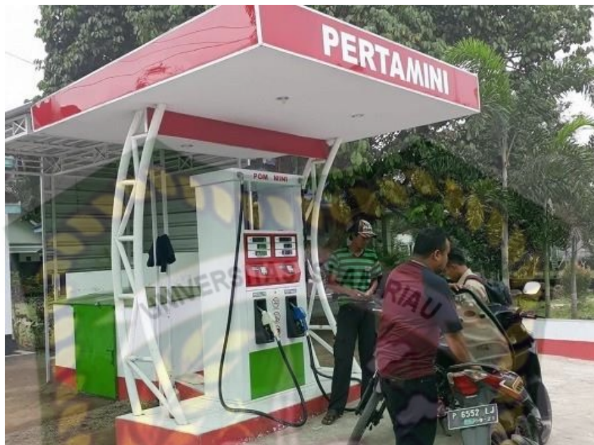
Gambar 4 Pertamini Model Digital

Tidak hanya bisa dibawa kemana-mana, penjual bisa menentukan lokasinya bahkan penjual bisa langsung memantau di mana saja tempat-tempat strategis untuk memperdagangkan BBM ini. Keunggulan Pertamina antara lain: