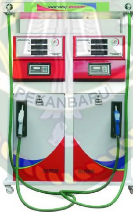
Gambar 2 Pertamina Model Portable

Mesin yang digunakan untuk menyimpan bensin terletak pada casing mesin dan pada model portable Pertamina ini digerakkan menggunakan roda. Jenis mesin Pertamina ini biasanya digunakan oleh operator skala kecil untuk memulai bisnis ini sehingga mereka dapat menjual bahan bakar menggunakan mesin Pertamina model portabel.