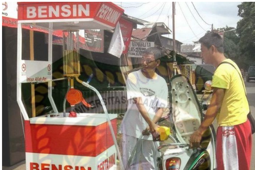
Gambar 3 Pertamini Model Portable