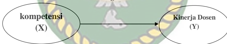
Gambar 2.1 Kerangka Penelitian

Berdasarkan latar belakang masalah, rumusan masalah, tujuan dan juga manfaat penelitian, telaah pustaka, penelitian terdahulu, maka dapat di buat struktur penelitian sebagai berikut :