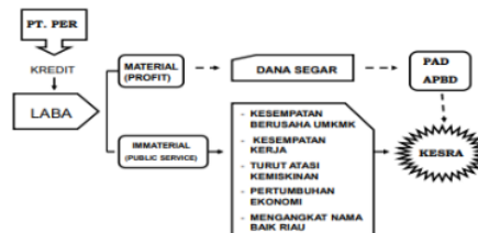
Gambar 2. Peranan PT. PER sebagai Lembaga Keuangan

5 Eksistensi PT. PER Provinsi Riau mempunyai fungsi pokok pelayanan umum masyarakat dan sebagai salah satu sumber PAD. Dalam menjalankan fungsinya tersebut harus mampu membiayai dirinya sendiri dan harus berusaha mengembangkan tingkat pelayanan kepada masyarakat, artinya setiap usaha yang dijalankan harus dapat menghasilkan keuntungan yang dapat digunakan untuk operasionalisasinya dan selebihnya untuk membiayai kegiatan pembangunan daerah menyangkut aspek kehidupan masyarakat lainnya.